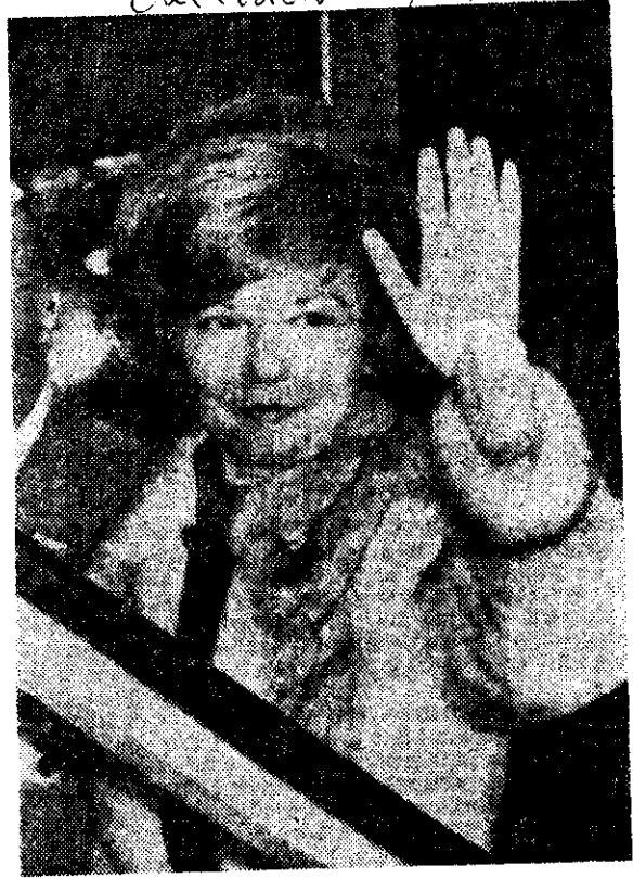
LA EX PRESIDENTA de Argentina, María Estela Martínez (Isabel) de Perón, se despide de un grupo de simpatizantes en el aeropuerto Ezeiza de Buenos Aires, momentos antes de partir ayer rumbo a Madrid, España.