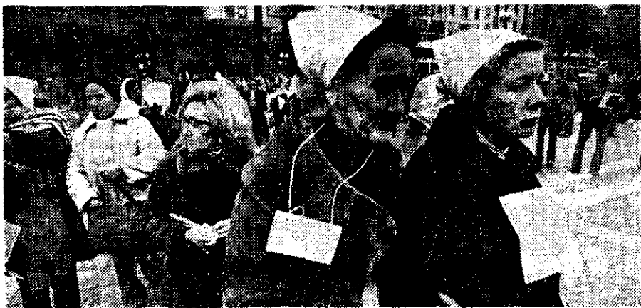
En silencio y con el corazón deshecho pasean estas señoras

Ahora la duda que queda es si estas mujeres podrán reunirse los jueves venideros, cuando haya terminado este evento deportivo mundial.