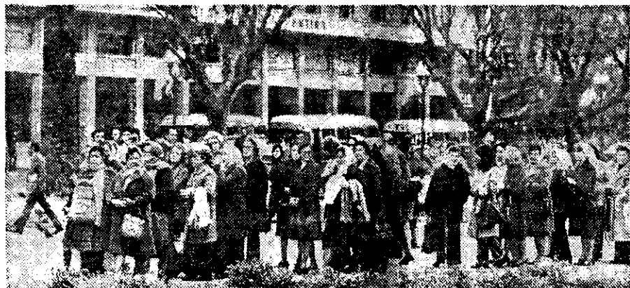
LOS JUEVES de cada semana se reúnen las señoras para protestar por la desaparición de un ser querido.