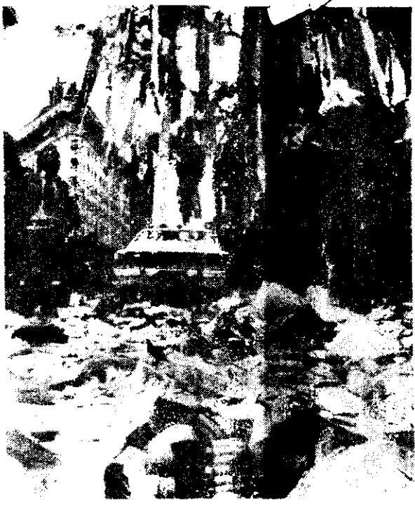
Amanecer del lunes en Buenos Aires: una pequeña, envuelta en una bandera argentina, no acierta a entender por qué la ciudad está tapizada de papeles. En la otra foto, el símbolo del Mundial 78 yace entre los restos de la celebración, cuando ya todo ha terminado.