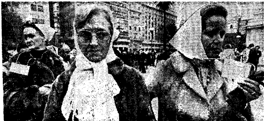
"QUE APAREZCA mi hijo" y "queremos saber dónde están nuestros hijos", rezan los letreros de estas señoras.