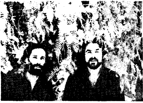
"LOS HUINCAS" presentarán hoy en una escuela de la UNAM, su espectáculo "Tango y Folclore".