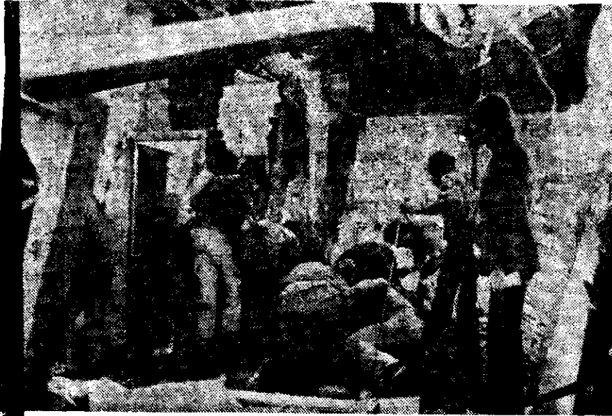
ARIOS VECINOS saquean las ruinas de una casa en Buenos Aires, luego del saqueo efectuado por fuerzas gubernamentales. Hubo siete muertos —entre ellos dos niños—. Las autoridades dijeron que la casa era un refugio Montonero.

Así es como hoy una escuela judía y una sinagoga fueron atacadas, aunque hasta el momento no se sabe si existieron víctimas en esos hechos.