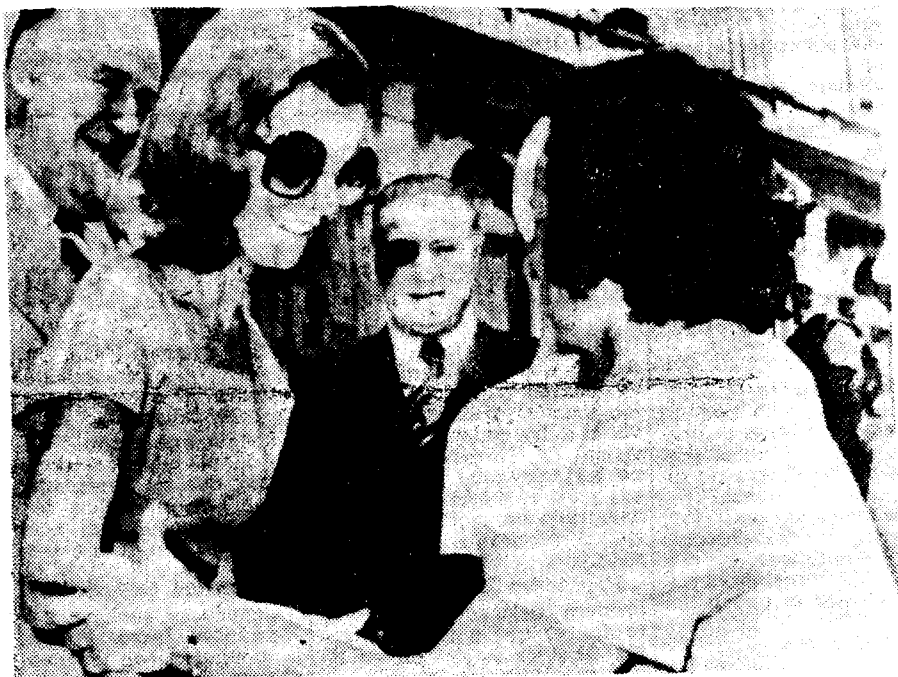
LA PRESIDENTE de Argentina, Isabel Perón, saluda a una enfermera durante un acto público, mientras se desempeña normalmente en el cargo a pesar de la presión para que renuncie.

El jueves fueron secuestradas en Córdoba siete personas, ignorándose hasta el momento su paradero.