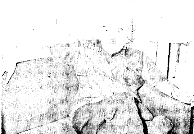
El problema de Argentina no es coyuntural sino el fracaso del sistema social de dependencia.

Al costo que sea la Argentina dará un salto hacia el futuro porque la actual crisis que vive no es transitoria ni coyuntural, sino que obedece al fracaso del sistema social de dependencia, señaló el ex-Rector de la Universidad Nacional de Buenos Aires, Profesor Rodolfo Puiggrós al analizar la grave situación política por la que atraviesa ese país.