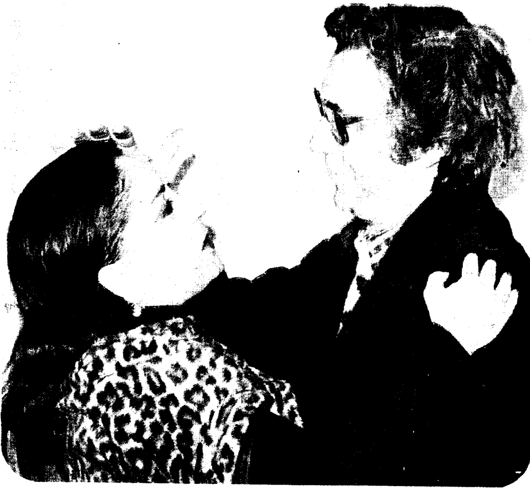
Fue muy efusivo el encuentro de Oswaldo con la primera actriz Ofelia Guilmain, que encabeza el reparto de "Heroica"