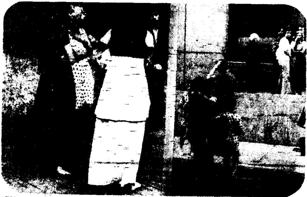
RESIDENTES DE Buenos Aires caminan por las calles con sus vestidos de noche luego del sismo ocurrido ayer en Argentina, y que dejó un saldo de 70 muertos y numerosos heridos.

A pesar de lo avanzado de la hora, numerosas personas bajaron a la calle.