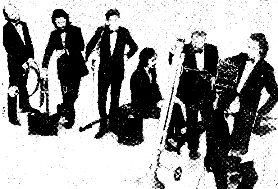
NUEVAMENTE ACTUARA en México el grupo "Les Luthiers". En la fotografía muestran algunos de los extraños instrumentos musicales que utilizan en sus audiciones.