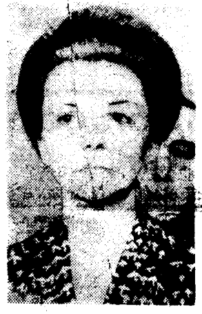
HOY SE conocieron planes completos de un complot militar para echar del poder a la Presidenta Isabel Perón.

BUENOS AIRES, 23 de marzo. (AP y AFP)—La Presidenta Isabel Perón permanecía hoy en su residencia suburbana de Olivos, mientras aguardaba un desenlace de la situación de crisis en medio de versiones de un inminente golpe militar. Al mismo tiempo, el ejército, la marina y la policía dominaban un brote guerrillero en el que participaron varios grupos, que combatieron toda la noche con ellos después de atacar el edificio de la jefatura de policía en La Plata.