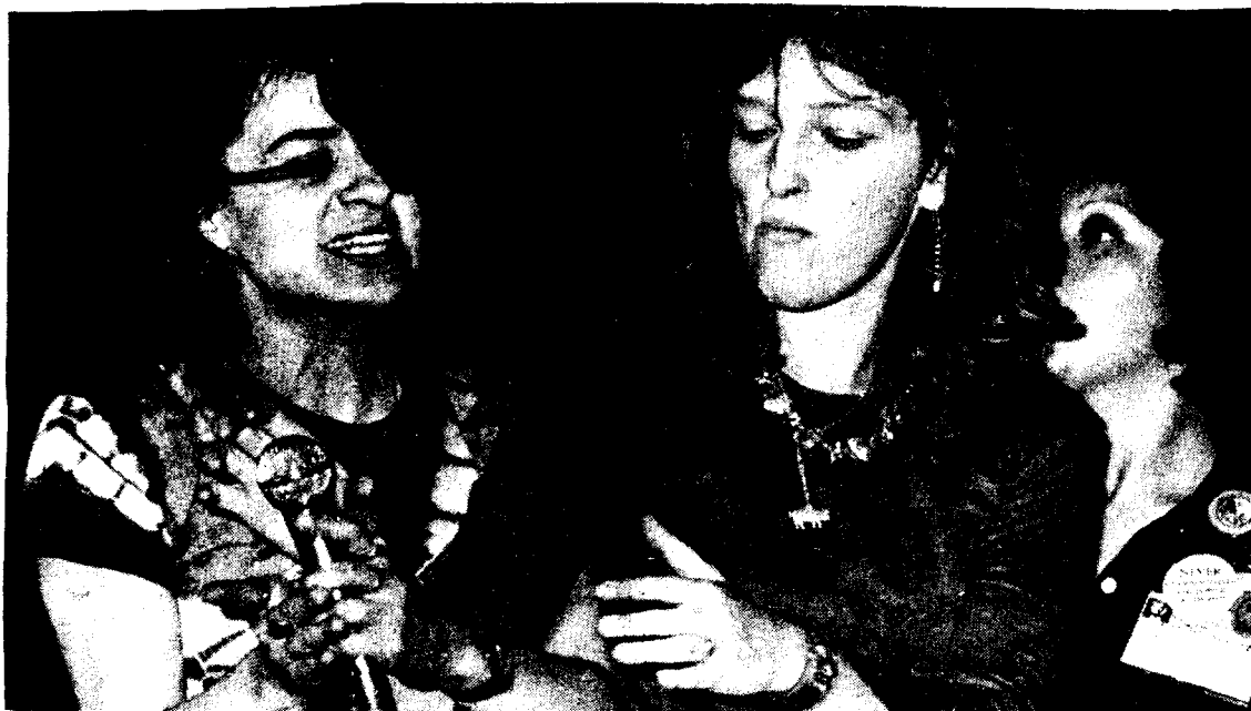
Como se quedaron con ganas de decir su verdad, éstas dos participantes en la Tribuna del Año Internacional de la Mujer se disputaron ayer el micrófono, convertido en verdadera manzana de la discordia, a pesar de que no servía, pues ante la gresca verbal el sonido fue cortado.

Las líderes de varios grupos (latinoamericanas, africanas, asiáticas, norteamericanas, europeas, etcétera) convinieron en tener un enfrentamiento abierto y público para definir posiciones y, si fuera po-