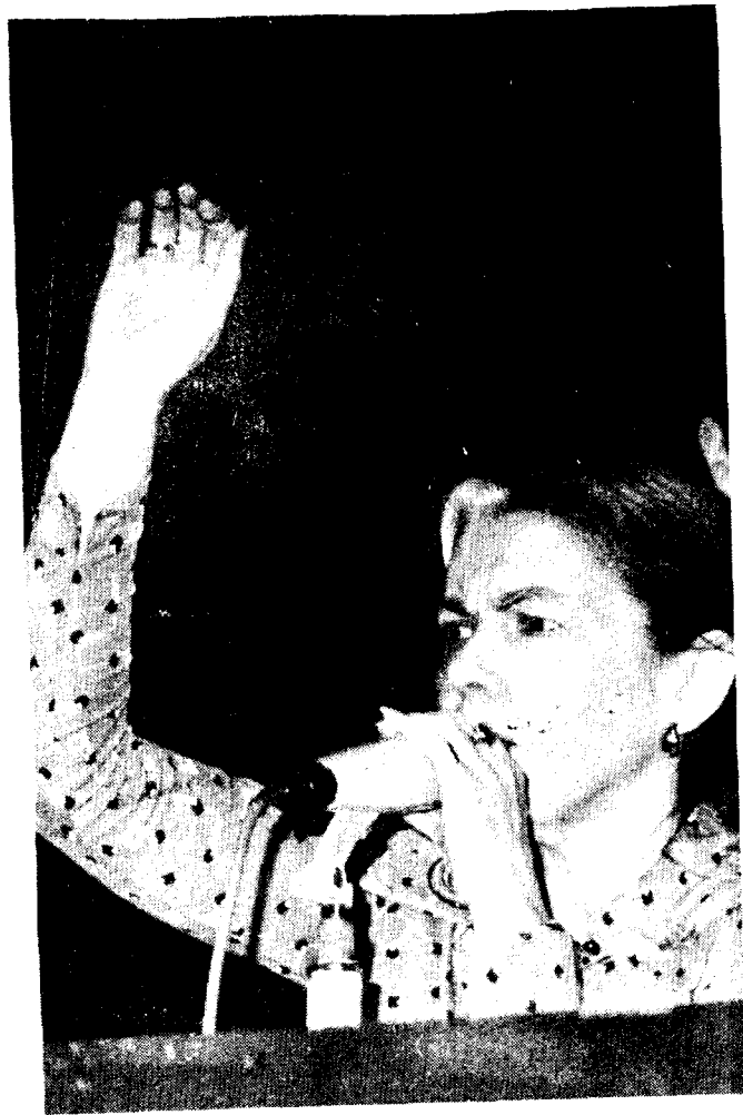
“¡Un momento!: En este auditorio habrá una conferencia sobre la paz...”