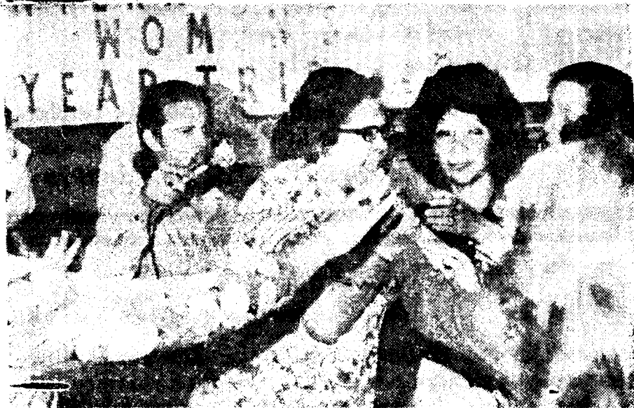
LATINOAMERICANAS de uno de los bandos que ayer fueron actoras de hechos violentos en la Tribuna del Año Internacional de la Mujer.