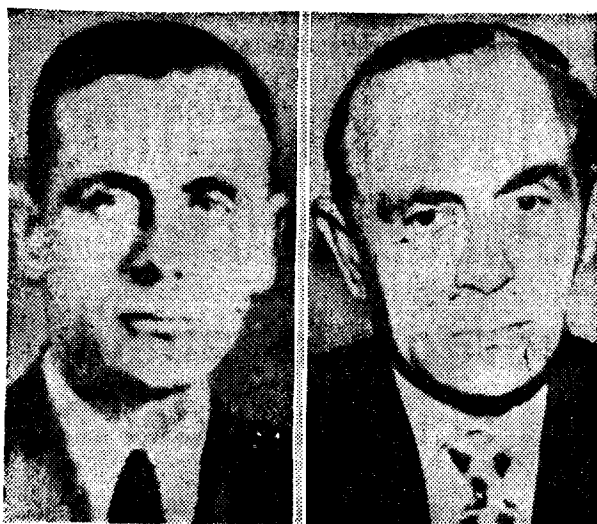
WALTER KUTSCHMANN , ex oficial de la Gestapo acusado de ejecutar a 38 judíos polacos en 1941, fue detenido ayer por la policía de Buenos Aires. A la izquierda, el ex militar nazi durante la Segunda Guerra Mundial. A la derecha, en una foto reciente.