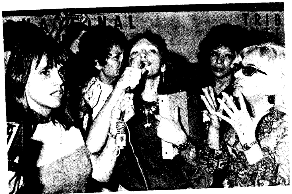
"Compañeras, hermanas: quiero hacer una denuncia..."