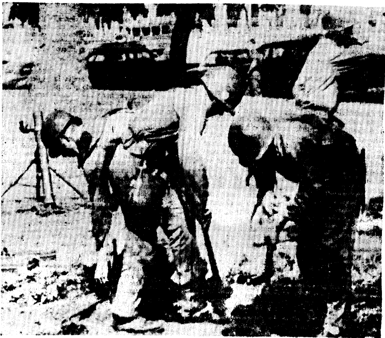
LOS MILITARES, con el espíritu de una generación avispada por la Segunda Guerra Mundial...

Ahora, con los precios internos hacia arriba y el escapismo del consumo —a la hora de renovación de los contratos colectivos— la protesta se generaliza en la violencia específica. Los centros de poder vuelven a integrarse en la vieja dinámica: entre el golpe de Estado y la continuidad angustiada.