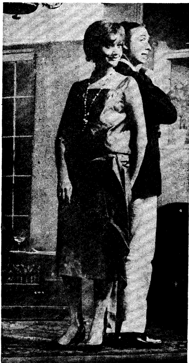
MARTA BIANCHI y Luis Brandoni en "Fiebre de heno", de Noel Coward.