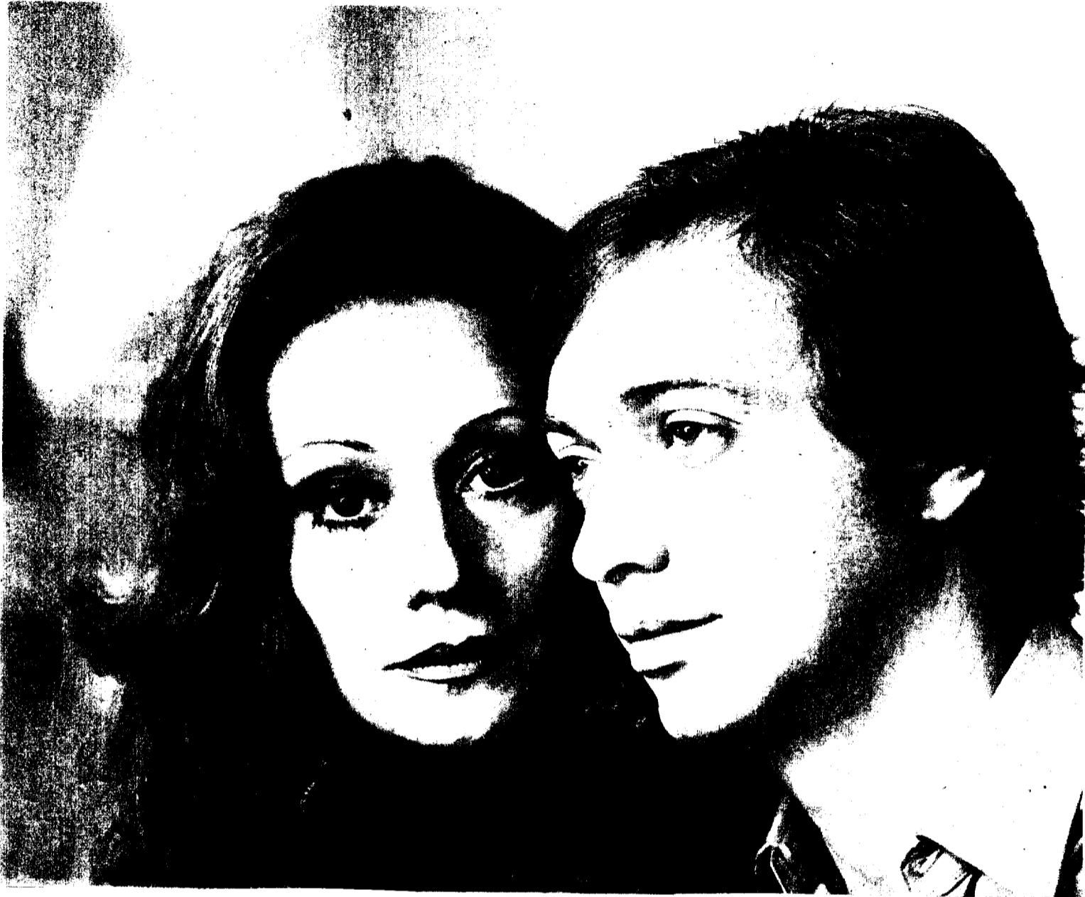
Martha Bianchi y Luis Brandoni

Ahora en México, acaba de iniciar el programa televisado "La mujer", en el que lee poemas —y basándose en ellos—, hace análisis de la mujer moderna. Y Martha Bianchi lo es.