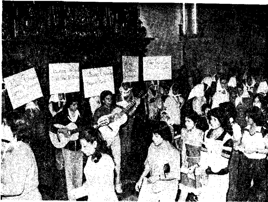
JOVENES mexicanos y argentinos asistieron a una misa, al finalizar las jornadas de ayuno en apoyo de la lucha por los Derechos Humanos en Argentina, donde según dijeron, hay 15.000 presos políticos.