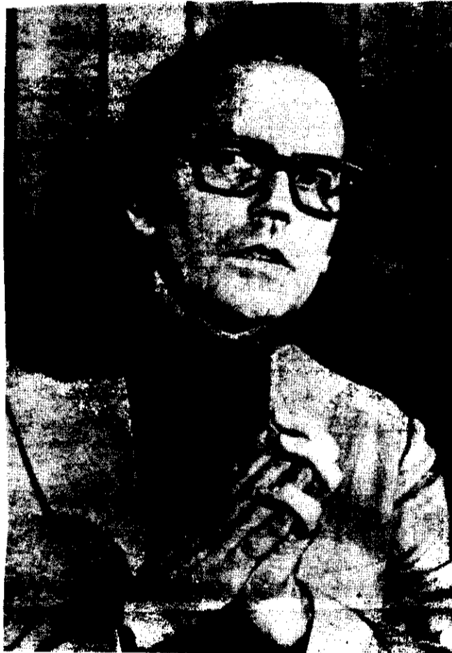
ADOLFO PEREZ ESQUIVEL