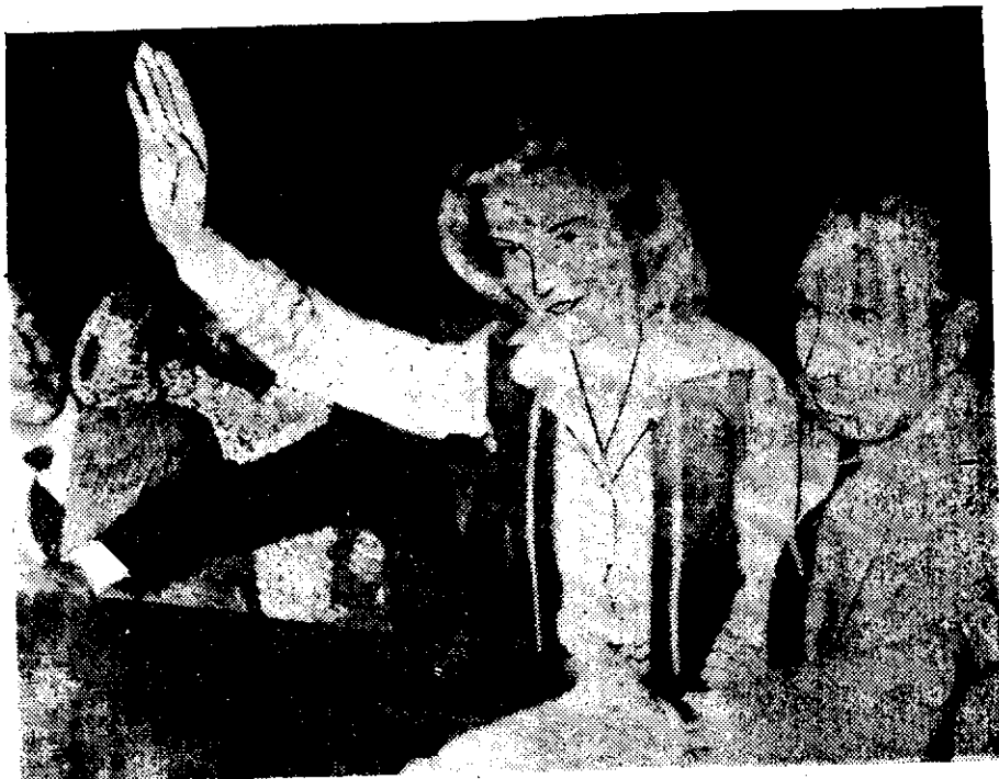
ISABEL PERON saluda a cientos de trabajadores peronistas que se reunieron frente a la Casa Rosada para expresarle su apoyo.

La policía federal fue declarada en estado de extrema alerta y fue convocada a retornar a sus cuarteles ante el anuncio de la concentración. Cientos de policías se congregaron en una plaza que está en la parte posterior de la Casa Rosada, al parecer para intervenir en caso de disturbios.