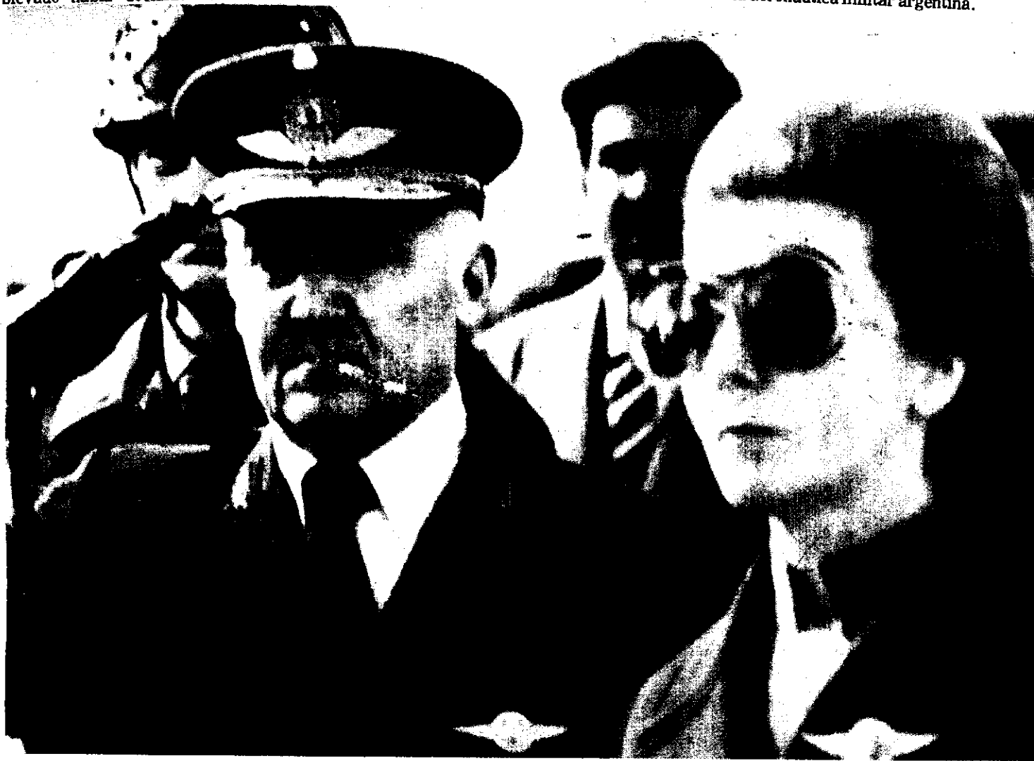
La presidenta argentina Isabel Perón, con el brigadier Héctor L. Fautario, relevado como jefe de la fuerza aérea.

Las unidades rebeldes, según los sublevados, incluían la quinta brigada, en Villa Reynolds, provincia de San Luis, la base de mayor poderío de la Fuerza Aérea, donde tienen su asiento los aviones "Skyhawk", considerados junto con los "Mirage" entre los más modernos con que cuenta la aeronáutica militar argentina.