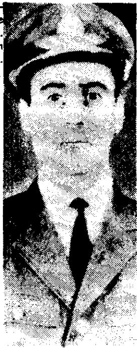
EL BRIGADIER Orlando Ramón Agosti fue designado comandante de la Fuerza Aérea argentina en sustitución del general Héctor Fantarín.

có al país en un mensaje, a "permanecer atento y en estado de alerta para impedir un golpe de estado".