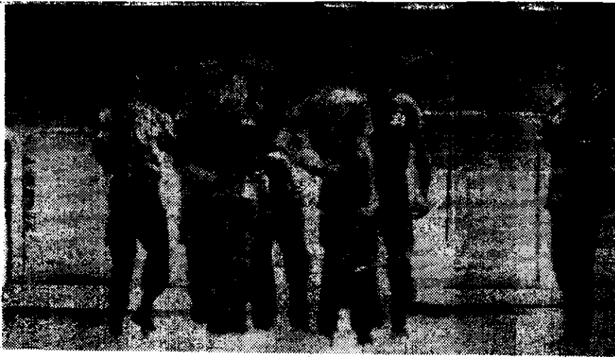
TROPAS DE LA Fuerza Aérea argentina, en la base militar del aeropuerto. Buenos Aires, tomada por oficiales rebeldes de esa rama.