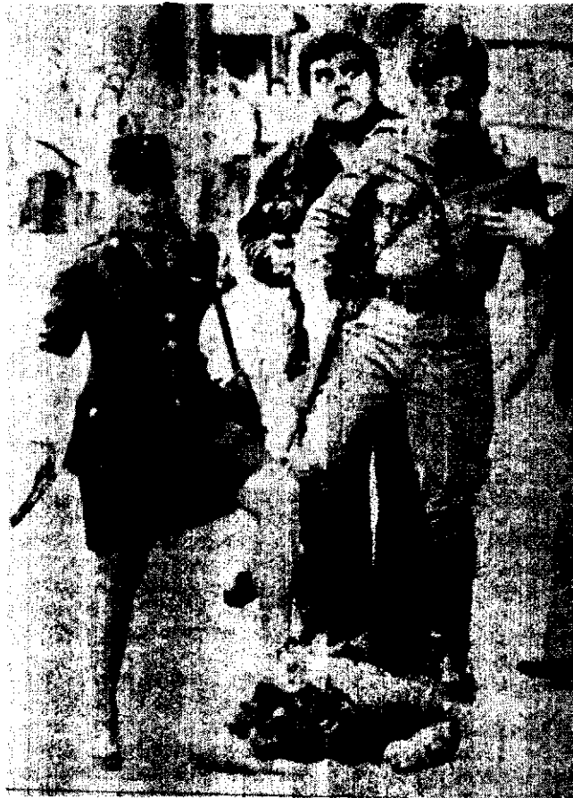
PISTOLA EN MANO, una mujer policía coloca su pie sobre el sospechoso de asalto a una joyería ubicada en una importante calle de Buenos Aires, Argentina. El presunto asaltante yace herido, lo cual no impide que un uniformado le propine un puntapié. Detrás, vestido de civil, aparece otro policía.