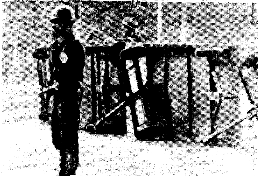
SOLDADOS rebeldes de la Fuerza Aérea argentina en una barricada hecha con un remolque volcado cerca de una base aérea en Buenos Aires. Los insurrectos controlan tres bases aéreas claves.

La Presidente de la República, que hoy asistió a su despacho en la Casa Rosada, convo-