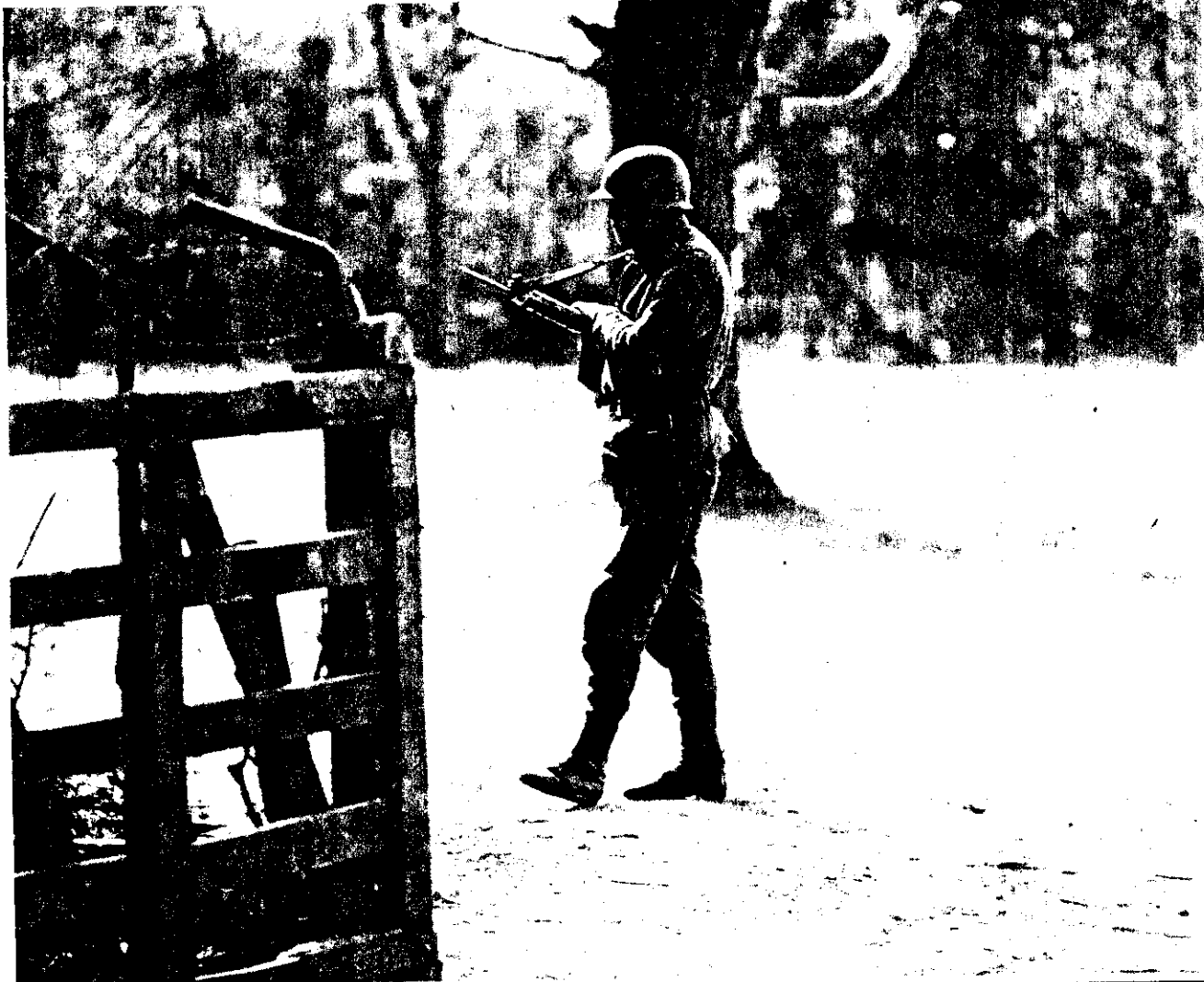
¡Y como la cuidan!