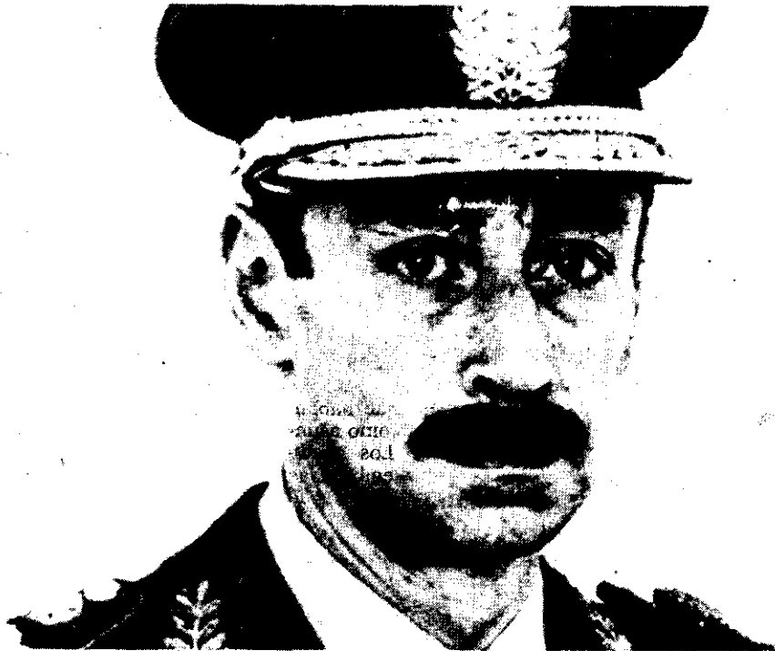
JORGE RAFAEL VIDELA

El ataque, señala el parte castrense, causó la caída de revoque.