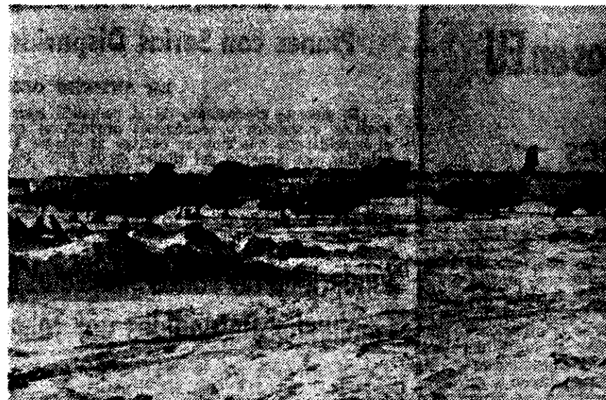
AVIONES PUCARA, de manufactura argentina, en el aeropuerto de Puerto Stanley nevado, a tres semanas de la reconquista británica de las Malvinas.

a la prensa británica por los marinos y soldados de los barcos, se supo que el Sheffield pudo haber sido salvado, pero que se recibieron órdenes para que fuera liberadamente fuera hundido. La nave —se explica— estaba en llamas y ante el peligro de una gran catástrofe que habría dejado muy mal puesto el nombre de Gran Bretaña, se prefirió hundir al Sheffield.