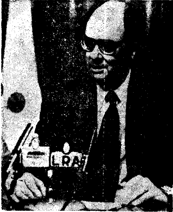
EL MINISTRO de Economía argentino, José M. Dagnino Pastore, informó anoche que la situación económica de su país es de "emergencia nacional".

Sigue de la página tres ción, pues la soberanía emana del pueblo".