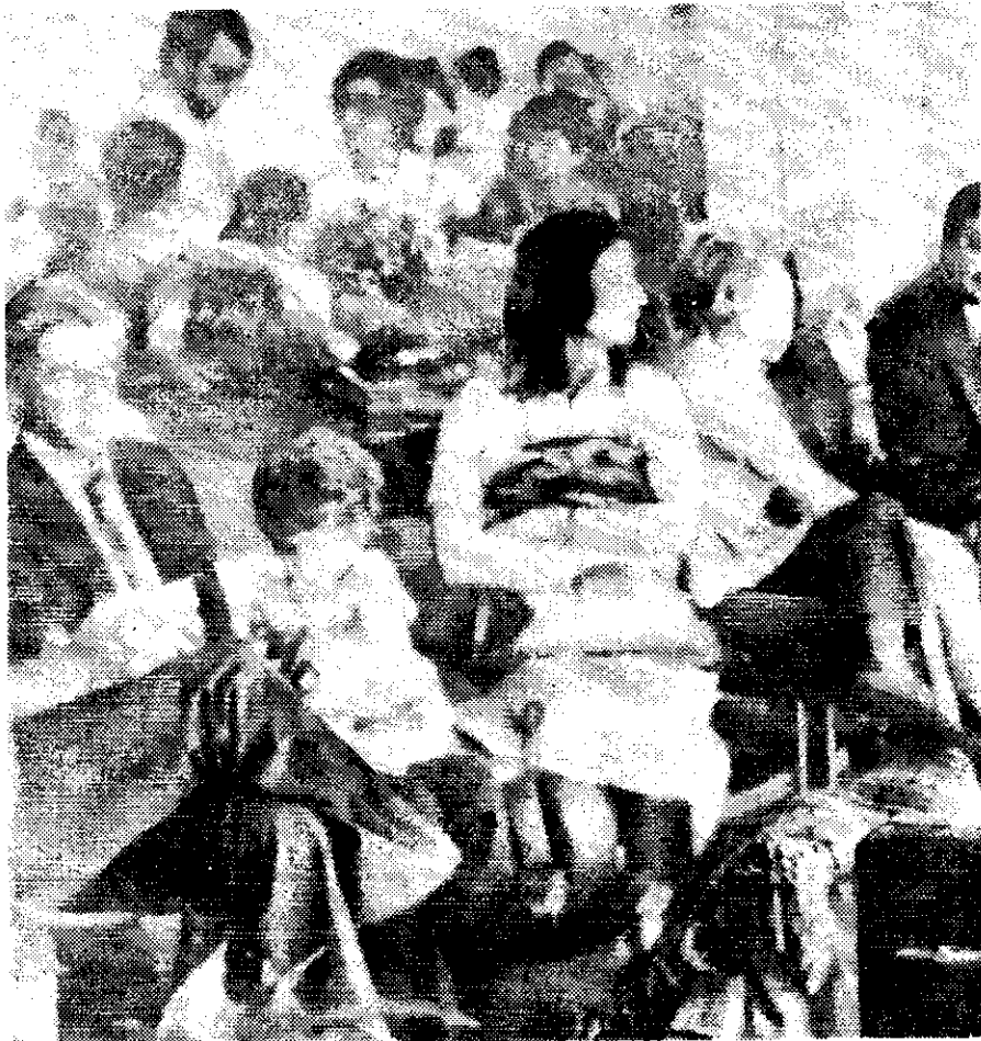
VARIOS PASAJEROS quedaron encerrados en un aeropuerto de Buenos Aires después que fue ocupado por un grupo militar rebelde.