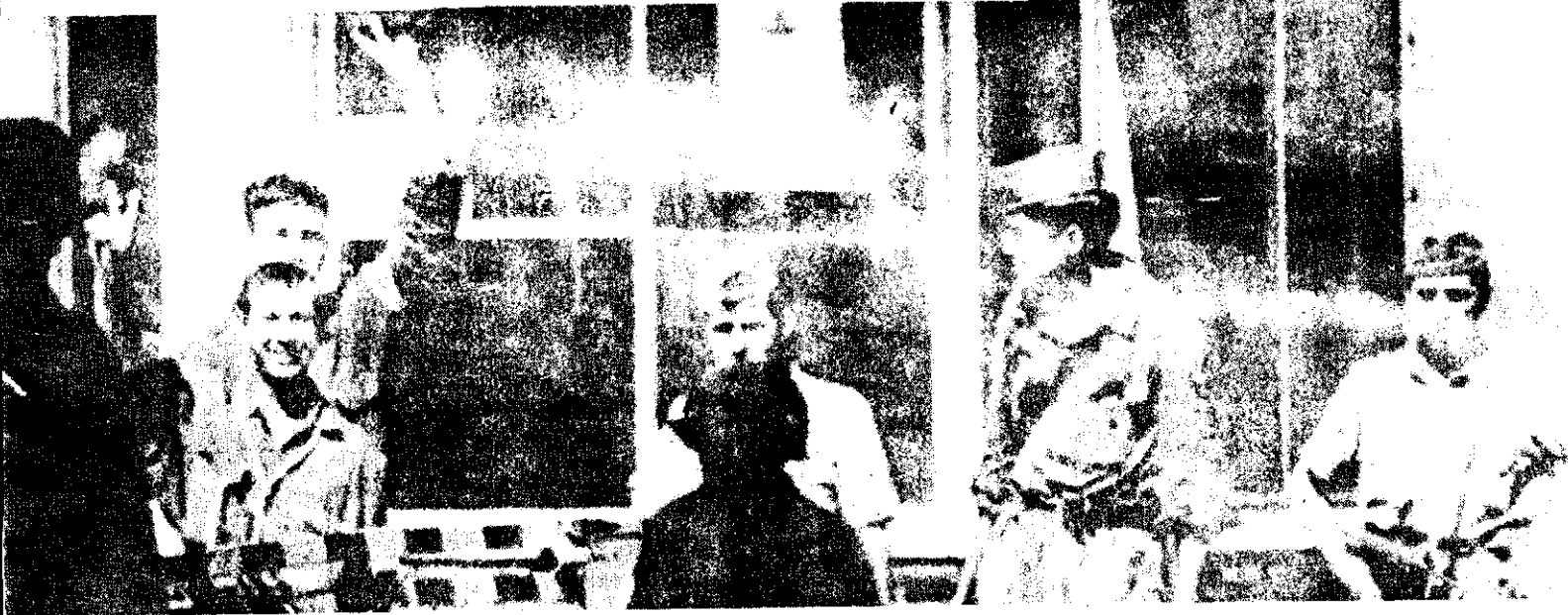
A pesar de que el conato de rebelión de una parte de la Fuerza Aérea argentina terminó con un acuerdo mediante el cual los insurrectos rindieron, estos soldados, de la guarnición del aeroparque de Buenos Aires que se unió a la asonada, hacen el signo de la victoria y lucen radiante