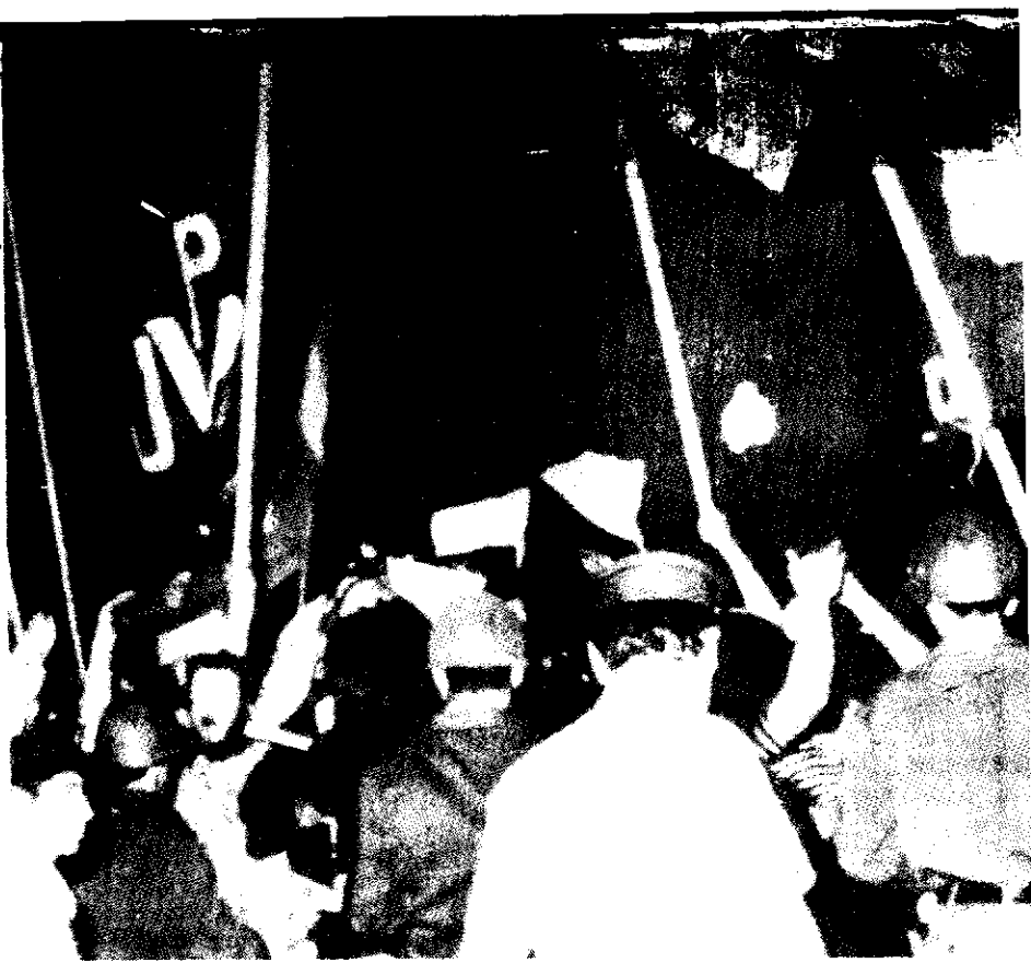
Manifestantes de la Confederación General del Trabajo (CGT) se congregaron frente a casa de gobierno para repudiar el intento golpista.

Poco antes el portavoz rebelde había dicho que "nuestra posición se mantendrá hasta las últimas consecuencias".