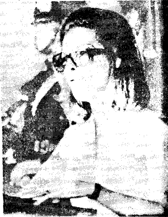
LA PRESIDENTE María Estela Martínez de Perón anunció anoche al pueblo argentino, por radio y televisión, que ya fue dominada la revuelta que contra el gobierno estalló en un grupo de la Fuerza Aérea há cinco días.

Aunque los métodos empleados por los golpistas fueron criticados por la mayoría de los jefes militares, nadie osó protestar por las acusaciones