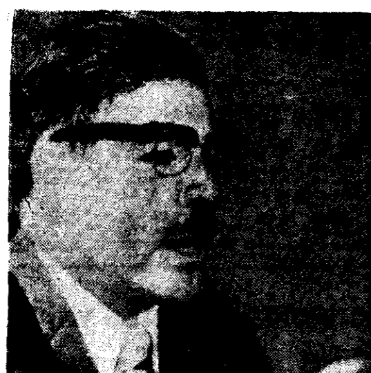
EL EX PRESIDENTE de Bolivia, Juan José Torres.