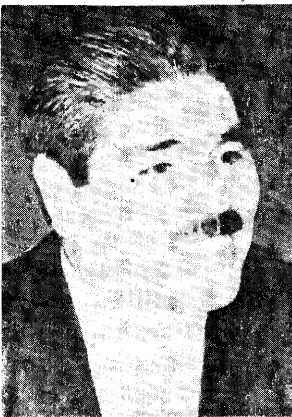
EL EX Presidente boliviano Juan José Torres —en una foto tomada en 1970— apareció muerto de tres balazos anteayer, a unos 100 kilómetros de Buenos Aires.

Los restos del general Torres —una vez repatriados— serán sepultados en su ciudad natal, Cochabamba, situada a 480 kilómetros de La Paz.