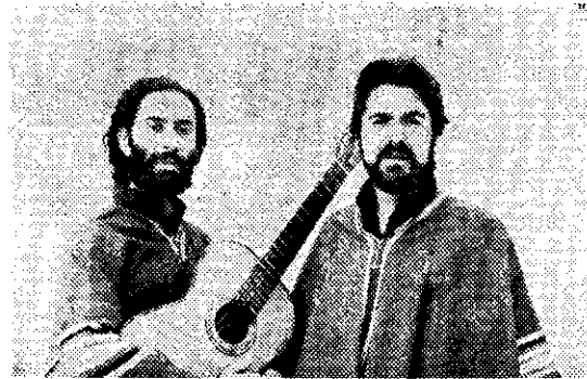
LOS HUINCAS, uno de los grupos argentinos que actuarán el domingo próximo en la Sala Nezahualcóyotl.