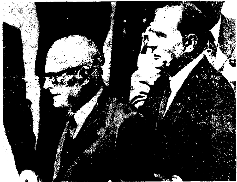
FRANCOIS Mitterrand acompaña a Sandro Pertini (izquierda) — a quien acompaña con Garibaldi —, a su llegada a París. El presidente de Italia aprovechó la oportunidad para recordar su exilio en Francia en épocas del fascismo.