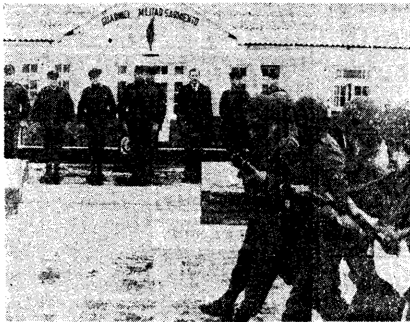
CRISTINO NICOLAIDES, cuarto a la izquierda, pasó revista a las tropas argentinas, en una base militar bonaerense, cerca de la capital. Anunció la reestructuración de las fuerzas armadas y pidió su colaboración para el regreso a la democracia en marzo de 1984.