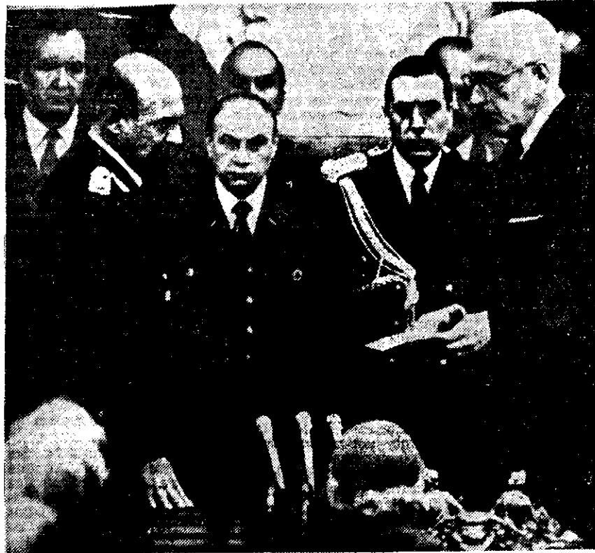
EL NUEVO MINISTRO argentino del Interior, general Llamil Reston, con la mano sobre una Biblia, prestó ayer juramento en la Casa Rosada, de Buenos Aires, ante el Presidente Reynaldo Bignone. El Mandatario hizo lo propio con todo su gabinete.

Las relaciones entre Estados Unidos y Argentina están deterioradas debido al apoyo que dio Washington a Inglaterra en la crisis de las islas Malvinas.