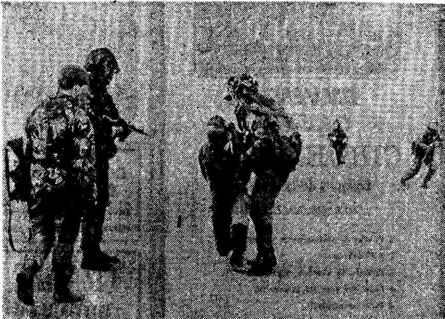
TROPAS BRITANICAS someten y encapuchan a un prisionero argentino, durante la guerra de las Malvinas. La foto fue distribuida el domingo por el Daily Express.