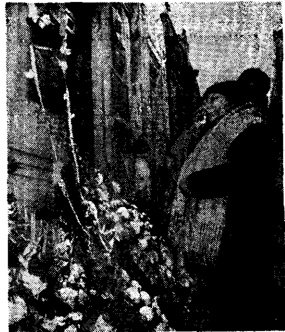
UNA MUJER argentina se enjuga una lágrima, ayer en el cementerio de Chacarita en Buenos Aires, durante la conmemoración a la que asistieron unas 150 personas, con motivo del octavo aniversario de la muerte del Presidente Juan Domingo Perón, acaecida en 1974.