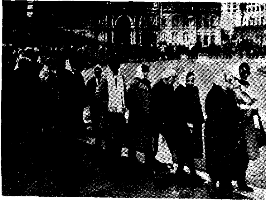
UNA LARGA FILA de mujeres marcharon ayer, como cada semana, frente a la Casa Rosada, en Buenos Aires, para pedir al gobierno que aclare la desaparición de sus familiares perdidos entre 1975 y 1978.