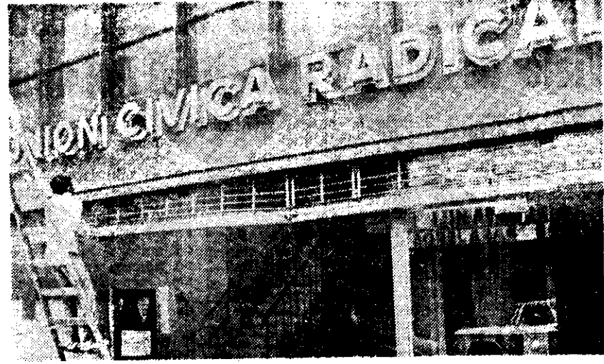
UN OBRERO argentino instala el letrero de la UCR, un día después de que el nuevo gobierno levantó las restricciones a las actividades de los partidos políticos. Igualmente, los homenajes a Perón se iniciaron de inmediato con un mitin donde se repartieron volantes en los que se critica a la junta militar.

"Se sorprendieron de ver que la amenaza a sus países no proviene de la Unión Soviética, como muchos de ellos pensaban, sino de las potencias colonialistas e imperialistas. Esto cambió las actitudes hacia las superpotencias en muchos Estados donde Moscú era considerada con sospecha", terminó.