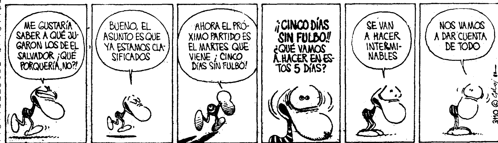
EL DIBUJANTE Caloi reflexiona en Clarín sobre cómo hasta el futbol mismo fue manipulado para desinformar al pueblo sobre lo que ocurrió en las Malvinas.

vidual por despojarlos parecía vano. La credibilidad, en este punto, estaba ya gravemente vulnerada, pero, por decirlo así, el aparato informativo era tolerado con cierta resignación por la población. Hasta que llegó la crisis de las Malvinas.