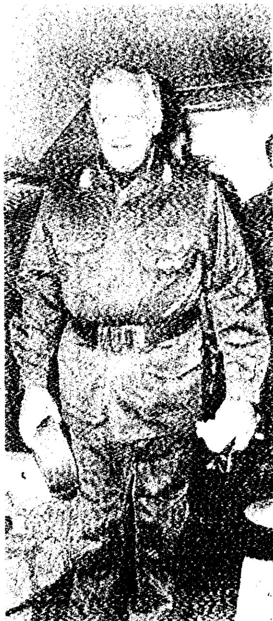
Galtieri. — El ya no podrá responder.

antes del Campeonato del Mundo. Pienso que el fútbol argentino entra en una etapa distinta en la que los dirigentes deben hacer su planteo personal, y que la irritabilidad que puede provocar el nombre de un técnico que no es ya campeón del mundo, puede crear confusiones y no aportar nada al fútbol argentino”.