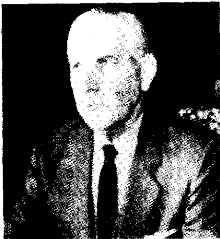
El nuevo presidente Reynaldo Bignone: ¿qué habrá de pasar en Argentina?

El jueves último asumió en Buenos Aires el séptimo presidente que ya han consumido las Fuerzas Armadas de ese país en sus seis años al frente del gobierno. Esta vez se trata del general (retirado) Reynaldo Bignone. La ceremonia fue rutinaria y dejó absolutamente pasivo a un pueblo a la vez indignado y divertido con la ineptitud de los generales. Expresión del caos suscitado entre los militares por la capitulación ante Gran Bretaña tras la aventura de las Malvinas, en la juramentación de Bignone estuvo ausente una de las tres armas que integran la Junta Militar, la Fuerza Aérea, cuyo comandante Basilio Lami Dozo no participó de la ceremonia en la Casa Rosada. El jefe de la Marina, Jorge I. Anaya, sí estuvo, pero entre los "invitados". Bignone asume, de este modo, como mandatario exclusivo del Ejército. Su mandato comenzó el mismo día en que el pueblo argentino conmemoraba el octavo aniversario de la muerte de Juan Perón, el líder popular electo presidente en 1973 por el 62 por ciento de la población y que muriera apenas ocho meses y medio después de haber asumido su cargo.