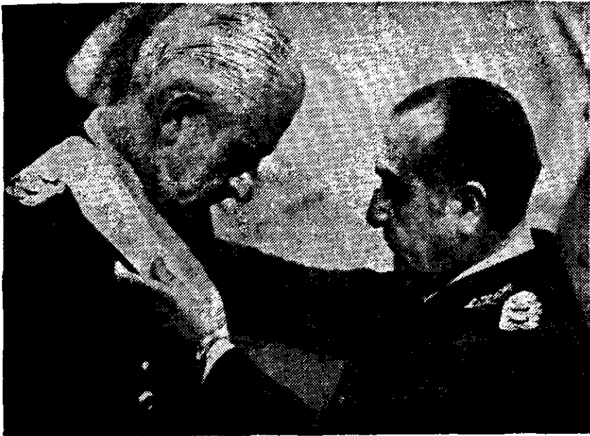
REYNALDO BIGNONE, investido ayer, en Buenos Aires, como Presidente de la República Argentina. Le coloca la banda presidencial el comandante en jefe del ejército, general Cristino Nicolaides.