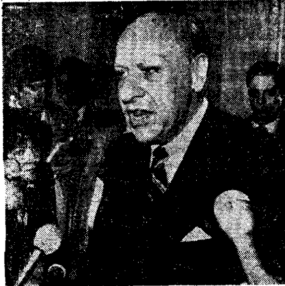
JUAN AGUIRRE Lanari, nuevo canciller argentino, manifestó ayer en Buenos Aires que su país se rehúsa a considerar terminadas las hostilidades en el Atlántico Sur, y que "seguirá luchando" por las islas Malvinas.

(c) 1982, The New York Times News Service