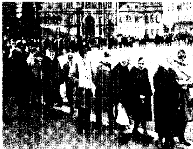
Las Madres de la Plaza de Mayo marcharon ayer, como todos los jueves frente a la casa de gobierno, en Buenos Aires.

Así lo informó la superioridad del arma terrestre, agregando que el informe respectivo será entregado a periodistas nacionales y extranjeros por el jefe del personal del estado mayor, general de brigada Miguel Ángel Podestá.