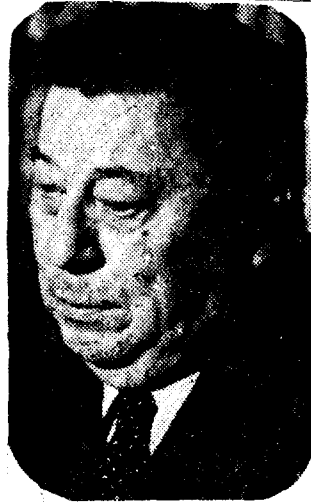
Atahualpa Yupanqui: "El mejor de los boxeadores, Cassius"...