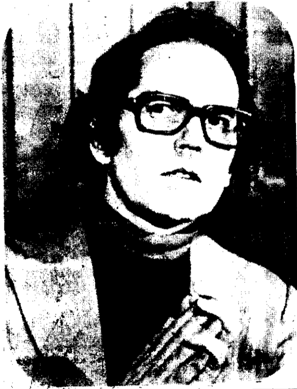
BONN, 6 de diciembre. — El argentino Adolfo Pérez Esquivel, Premio Nóbel de la Paz, hizo un llamado a Alemania Federal y otras naciones industrializadas de occidente para que frenen sus exportaciones de armas a América Latina.