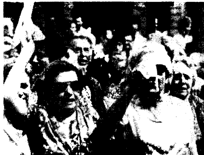
Las madres de los desaparecidos piden información sobre el paradero de sus hijos ayer por las calles de Buenos Aires. Quince de ellas fueron detenidas.

Los refugiados argentinos, junto con una comisión del Movimiento Mexicano por la Paz, entregaron allí una carta al agregado militar, coronel Rodríguez, y en ella le exigieron a la sede diplomática que dé respuesta a un mensaje, entregado el 14 de agosto por las fuerzas populares y democráticas mexicanas, en el cual se pedía una explicación al gobierno argentino sobre el paradero de 30 mil personas desaparecidas por la dictadura de ese país en los últimos cuatro años.