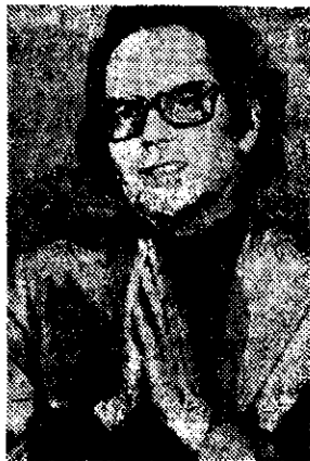
ADOLFO Pérez Esquivel, Premio Nobel de la Paz 1980, durante una conferencia de prensa en Bonn el viernes.