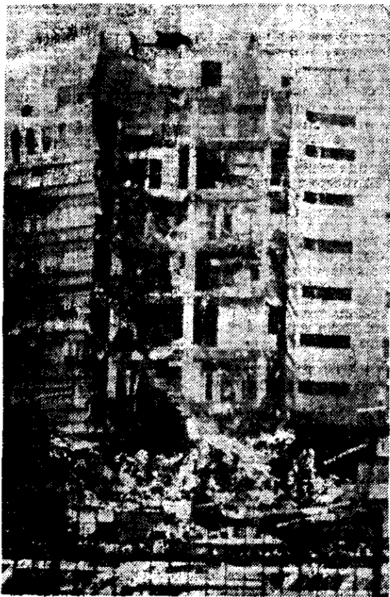
MAS DE treinta personas resultaron heridas al derrumbarse ayer siete pisos del edificio que albergaba a las oficinas centrales de la Fuerza Aérea de Argentina, en Buenos Aires.