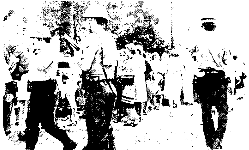
POLICIAS FEDERALES argentinos armados de pistolas lanzagases y bastones frente a la manifestación que las Madres de Plaza de Mayo y los Familiares de Presos y Desaparecidos por razones políticas realizaron en Buenos Aires el miércoles el reclamo de que el gobierno publique la lista y lugar de detención de los desaparecidos. La policía cargó contra los familiares, hiriendo por lo menos a tres y apresando a 27, cuya liberación fue reclamada ayer..

Citaron, como ejemplos, "la suspensión indefinida del derecho de huelga y de las actividades gremiales en general, la prolongada intervención de organizaciones sindicales, la suspensión de las negociaciones colectivas de trabajo, la detención y procesamiento extra-jurídico de dirigentes obreros".