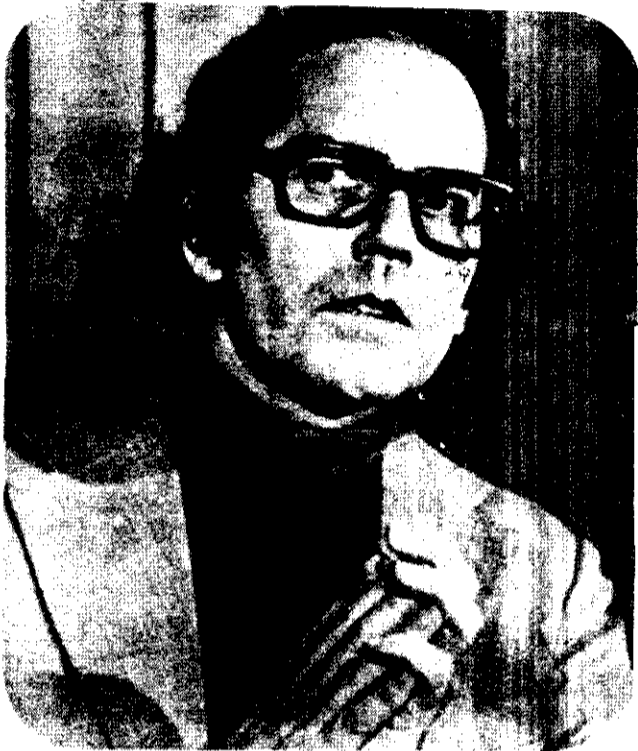
ADOLFO PEREZ ESQUIVEL

La concentración se efectúa en consonancia con la que el mismo día realizan frente a la Casa de Gobierno en Buenos Aires, las Madres de Plaza de Mayo y Familiares de Detenidos y Desaparecidos políticos, para exigir respuesta a las autoridades al petitorio presentado el 14 de agosto pasado, exigiendo la publicación de las listas de los desaparecidos.