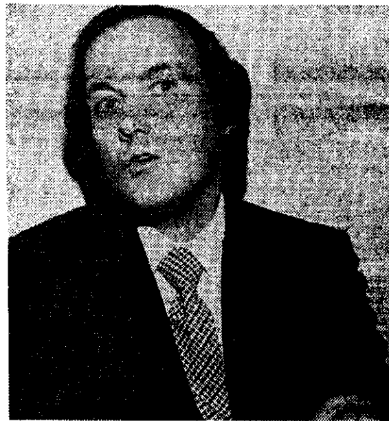
MARCELINO CERELJIDO, ganador del Premio Hispanoamericano de Cuento 1979.

El escritor admitió haber pasado un "inolvidable mes" gracias a la invitación que aceptó de la fundación de Japón.