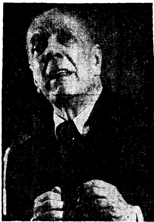
Jorge Luis Borges