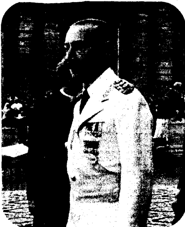
JORGE RAFAEL VIDELA

Una delegación oficial cubana invitó hoy al presidente Videla a concurrir a la reunión de jefes de Estado del Movimiento de Países No Alineados, a realizarse en septiembre de este año en La Habana.