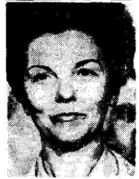
ISABEL PERON, cuya imagen se deterioró cuando fue derrocada, ha recobrado su popularidad. Circulan versiones sobre su posible retorno a la vida política argentina.

"La señora de Perón cree que sus valores políticos mejoran y que seguirán en alza en tanto se mantenga en silencio", declaró un visitante, que opinó que el prolongado arresto de la ex Presidenta, sin veredicto judicial, le está valiendo creciente simpatía popular.