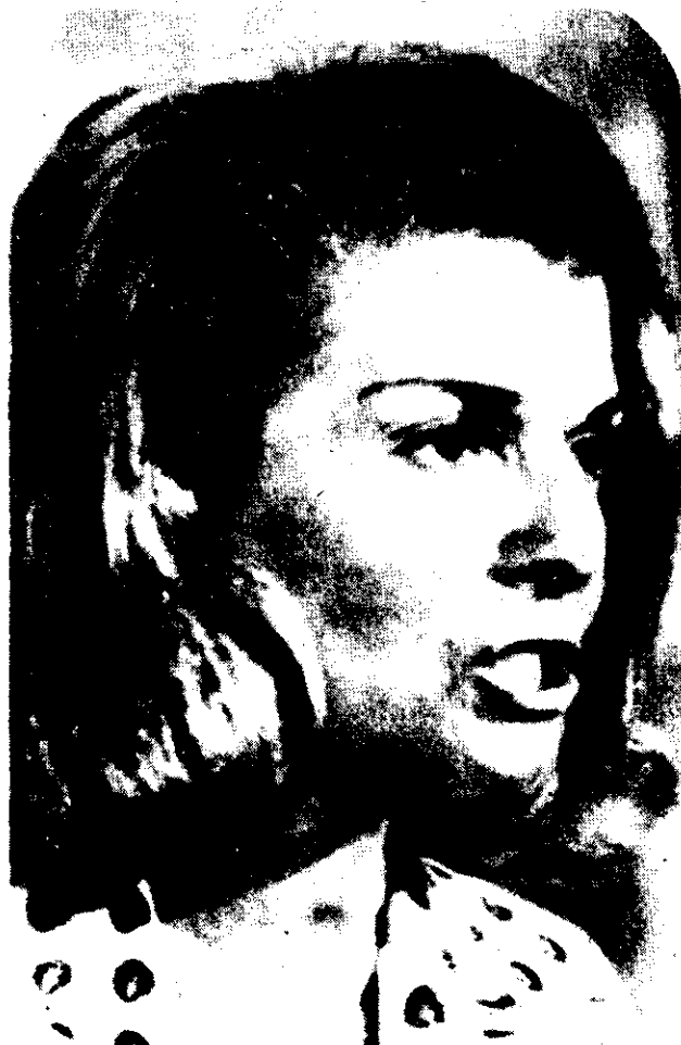
LA EX PRESIDENTA argentina María Estela Martínez de Perón, detenida bajo arresto domiciliario por la Junta Militar de ese país, fue intervenida quirúrgicamente de urgencia por padecer apendicitis, en el Hospital Militar Central de Buenos Aires. Su estado es satisfactorio.

Las peticiones fueron dadas a conocer a poco más de un mes de la anunciada llegada de la Comisión Interamericana de los Derechos Humanos de la OEA para verificar la observancia de esos derechos en Argentina.