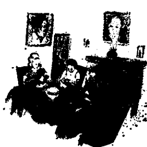
Mi hermanita y yo, amamos a mamá, papá, Perón y Evita.