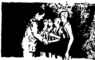
Perón ama a los niños

Y para finalizar nuestro breve reportaje, reproducimos una de las últimas páginas: "Gracias, Evita: Trabajo a mi papito, / juguetes para mí, / remedios a abuelito / y mamita feliz... / Todo esto te debemos / y lo quiero decir... / ¡Evita que en el cielo / descansarás al fin!..."