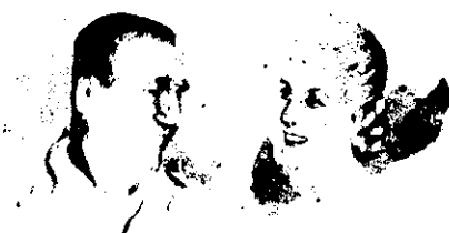
Perón y Evita, nos aman.