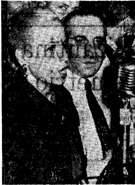
PRONUNCIANDO un discurso