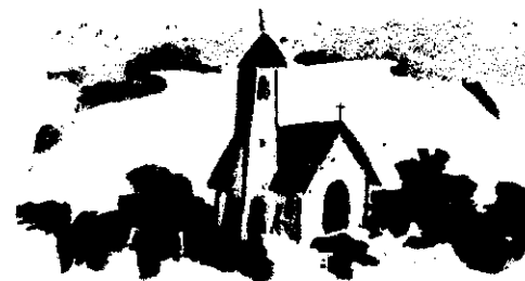
La casa de Dios

Eva Duarte de Perón cumplió veinticinco años de muerte. La ocasión permite a EXCELSIOR dar a conocer a sus lectores la SIGUE EN LA PAGINA DOS