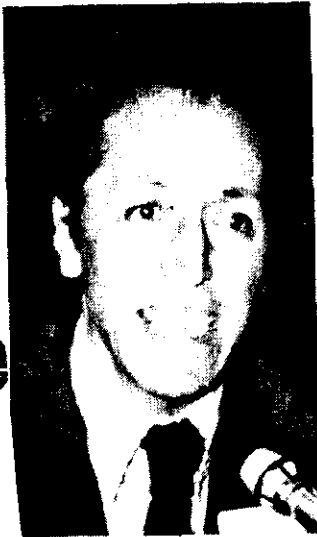
Quiroga Santa Cruz, de Bolivia