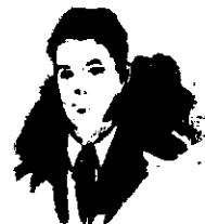
Mamá y papá me aman.