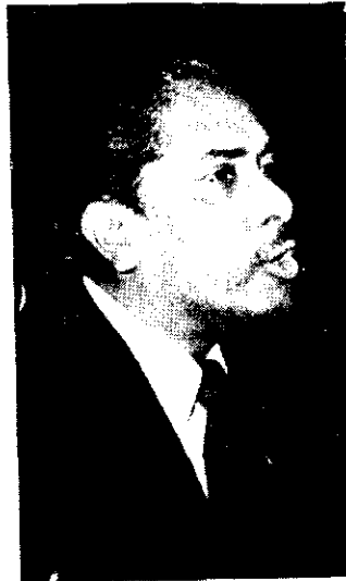
Mugran, de Surinam