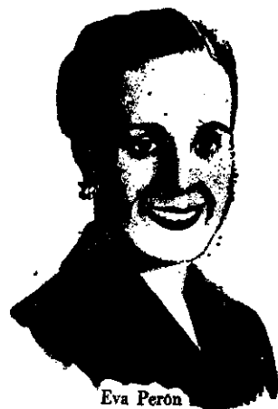
Eva Perón Jefa Espiritual de la Nación