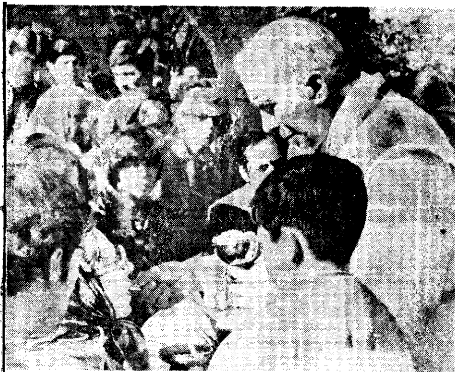
EL OBISPO Marcel Lefebvre da la comunión a una anciana, en la primera misa que ofició ayer desde su llegada hace unos días a Buenos Aires. La misa se celebró en una hacienda cercana a Buenos Aires.

Uno de sus colaboradores argentinos expresó que el seminario "se caracterizará fundamentalmente por la enseñanza de la doctrina de los Papas, además de rezar. No preparará sacerdotes para la guerrilla".