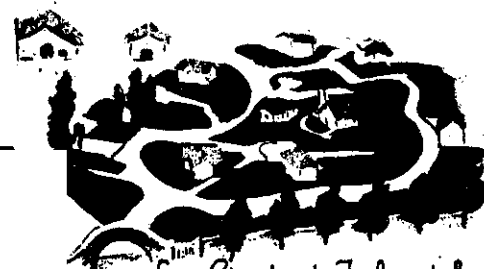
La Ciudad Infantil Obra de la fundación Eva Perón.