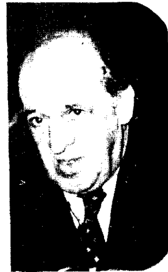
Erro, de Uruguay