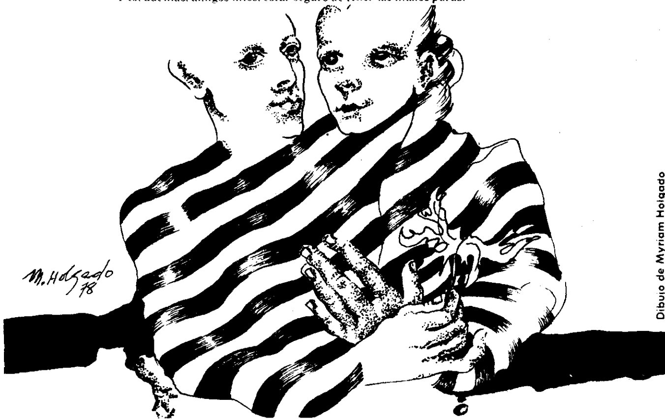
Dibujo de Myriam Hoigado

Estar enamorado, amigos, es padecer espacio y tiempo con dulzura. Es despertarse mañana con el secreto de las flores y las frutas. Es libertarse de sí mismo y estar unido con las otras criaturas. Es no saber si son ajenas o si son propias las lejanas amarguras. Es remontar hasta la fuente las aguas turbias del torrente de la angustia. Es compartir la luz del mundo y, al mismo tiempo, compartir su noche oscura. Es asombrarse y alegrarse de que la luna todavía sea luna. Es comprobar en cuerpo y alma que la tarea de ser hombre es menos dura. Es empezar a decir siempre y en adelante no volver a decir nunca. Y es, además, amigos míos, estar seguro de tener las manos puras.