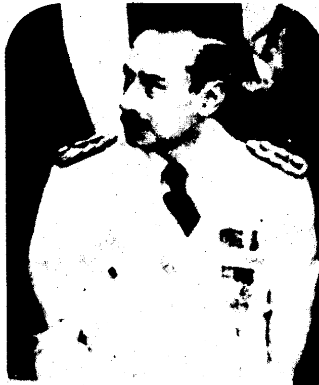
JORGE RAFAEL VIDELA

En una reunión con periodistas, con motivo de la próxima Navidad, Pinochet destacó la "coincidencia" que hubo en un momento en los dos países para elegir al Papa Juan Pablo II como mediador en la antigua controversia, pero no ofreció más detalles.