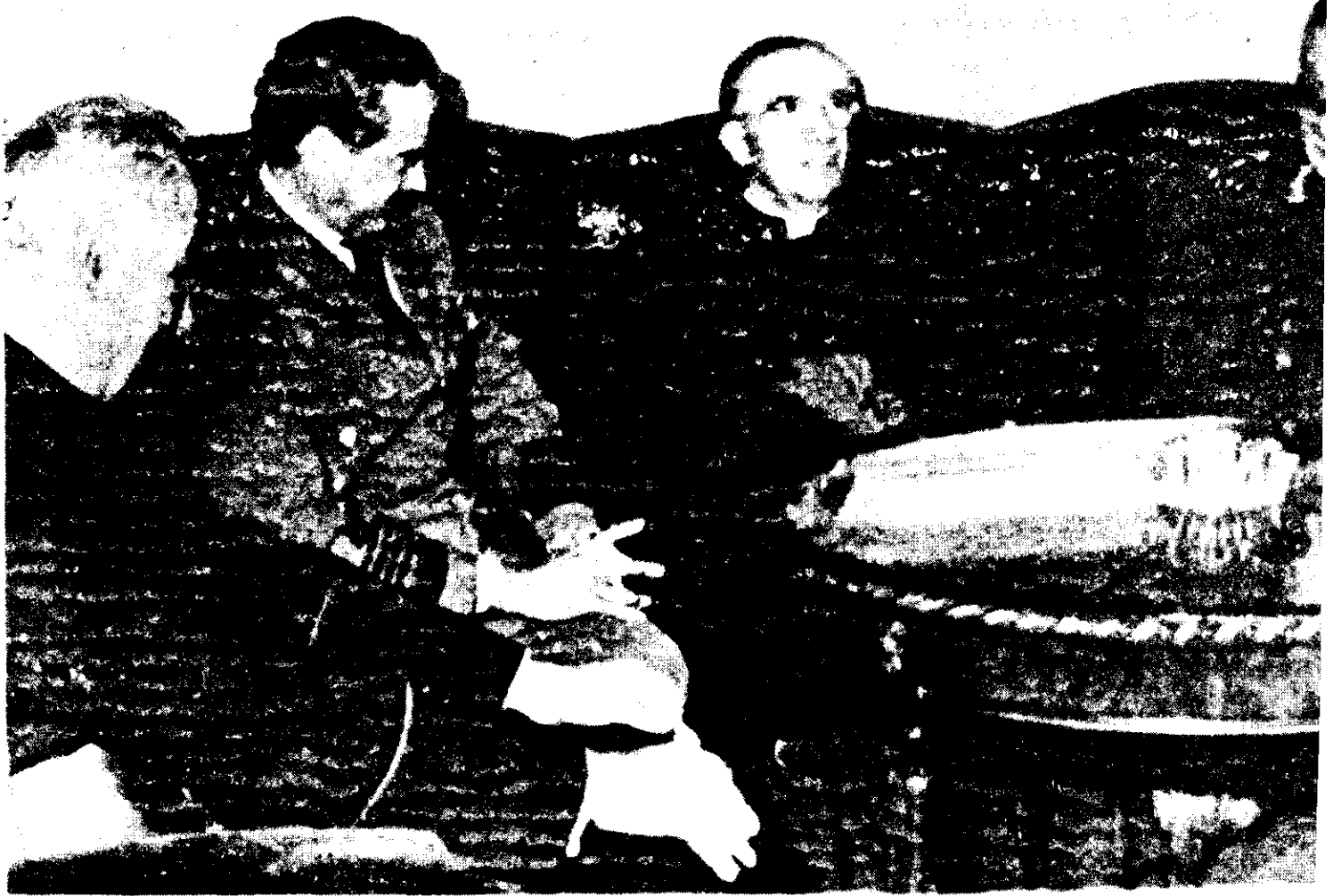
ENVIADO PAPAL. — La Junta Militar Argentina recibió al cardenal Antonio Samore, enviado por el Papa en una misión especial p ción en la disputa territorial con Chile. De izq. a der., el nuncio papal en Argentina, Pio Laghi, el comandante de la fuerza aérea Agosti; el cardenal Samore y el comandante en jefe del ejército, general Roberto Viola.