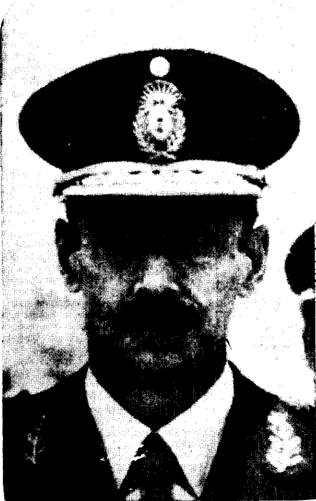
JORGE R. VIDELA