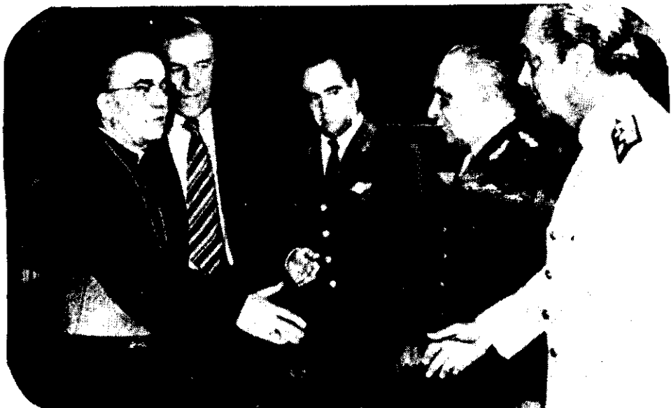
EL CARDENAL Antonio Samore, enviado del Papa para interceder en el conflicto limítrofe argentino-chileno, saluda a los miembros de la Junta Militar argentina, almirante Armando Lambruschini, de la Armada (a la derecha); al jefe del Ejército, general Eduardo Viola (al centro), y al general Orlando Agosti, jefe de la Fuerza Aérea.

El prelado dijo que ya cuenta con "la buena voluntad" de los gobiernos Chileno y argentino para interceder en el conflicto limítrofe entre ambos países