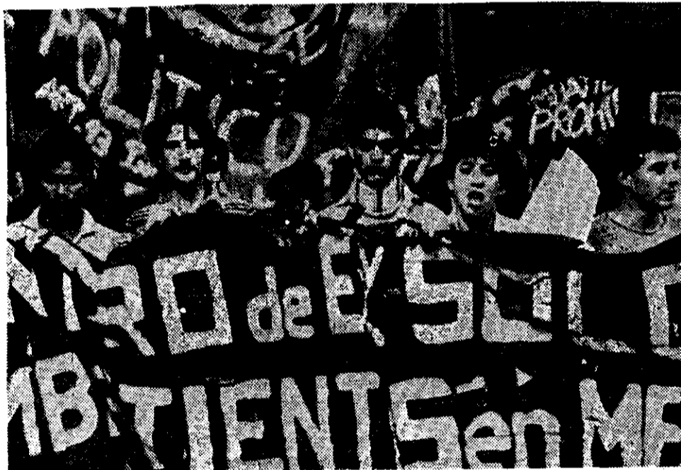
CIENTOS DE jóvenes argentinos, que participaron en la guerra de las Malvinas, realizaron una manifestación de protesta, en Buenos Aires, ayer. La manta que sostienen dice: "El gobierno nos llama héroes, pero al mismo tiempo nos margina".