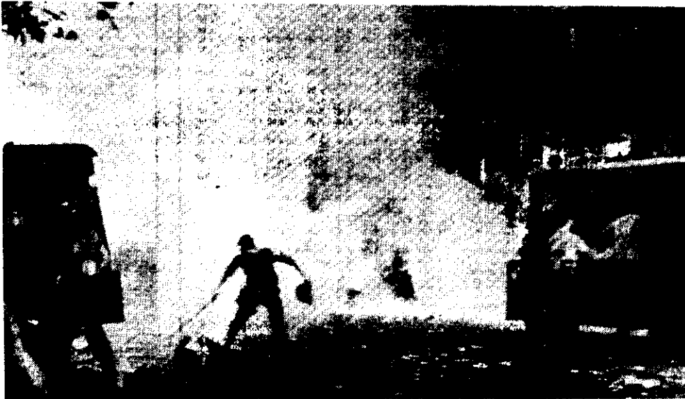
FOTOGRAFIA publicada en el matutino conservador La Nación, el más persistente defensor de la Junta Militar. También la publicó Clarín, con la crónica correspondiente a la manifestación de cien mil personas reprimida a garrotazos, gases y balas por la policía, el 16 de diciembre.

hacer inmediatamente después de aquella marcha de Plaza de Mayo, pretendiendo descargar sobre la sociedad civil presuntas responsabilidades por situaciones de las que ellos fueron principales productores y actores.