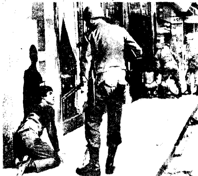
ARGENTINA: REPRISION en las calles.

que en estos casos ha asumido las formas de las luchas de masas, de las demostraciones callejeras, de los paros y las huelgas, está madurando las condiciones para el derribo del fascismo y el renacimiento de regímenes democráticos.