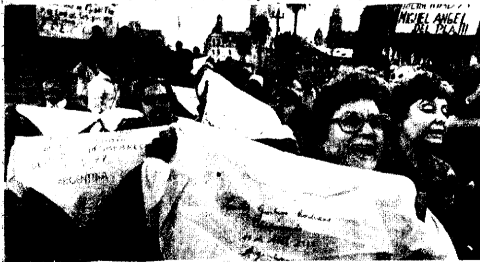
LAS MADRES DE la Plaza de Mayo: durante años, un baluarte de la resistencia a la dictadura militar argentina.

Pese a todo, no debe darse de la memoria de los pueblos y es de esperar que el argentino encuentre su camino y desaparezca a tanto incapaz de uniforme y de civil en la noche de los tiempos.