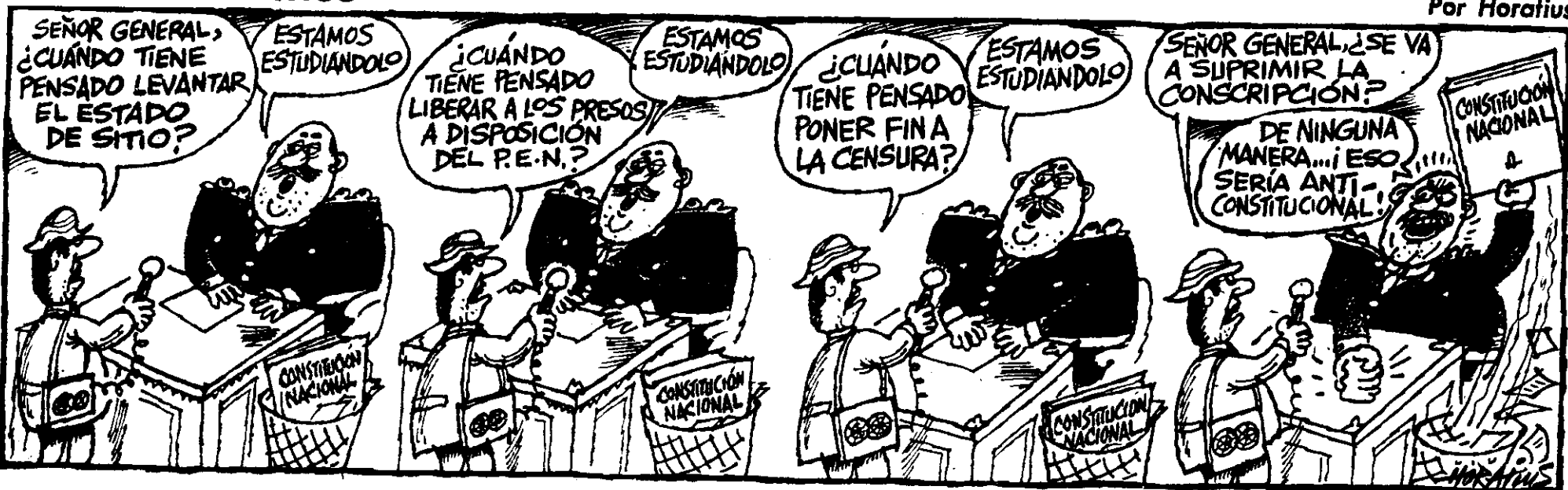
EL CARICATURISTA HORATIUS, DEL matutino La Prensa, de Buenos Aires, ilustra en la edición del 19 de diciembre de 1982 el modo en que los militares ubican en el bote de basura la Constitución Nacional, a la que solo recuperan e invocan cuando algo o alguien afecta los usos o mecanismos de su poder totalitario.

ma, el sistema, desde 1976 hasta 1980, y Narvaiz lo sabía tan bien como el resto del Poder Judicial y el cuerpo militar en su totalidad.