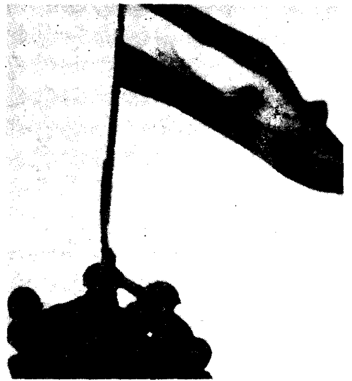
Malvinas: una guerra que conmovió los cimientos del sistema interamericano.

Sin embargo su política, de acuerdo con denuncias de organismos internacionales, se centró en una feroz represión en las regiones norte y occidental, los de mayor actividad insurgente: casi tres mil civiles habían sido asesinados en los primeros cuatro meses de gobierno, según denunció Amnistía Internacional.