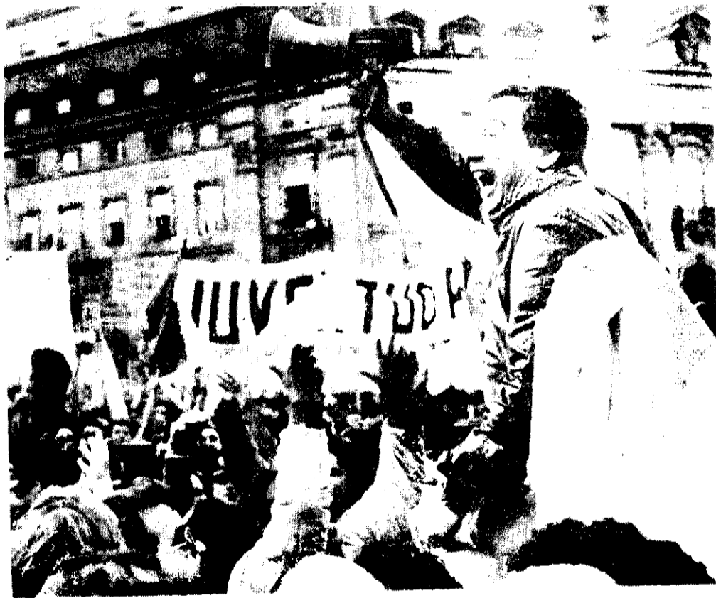
QUE SE VAYAN los militares: clamor del pueblo argentino.

Han transcurrido 18 años desde el golpe de Estado en el gi-