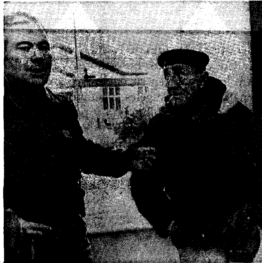
UN OFICIAL argentino traduce a un residente de las Malvinas. A pesar del bloqueo naval, la ocupación continúa.