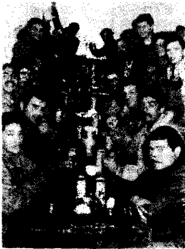
Tropas de ocupación argentinas, en el comedor de sus cuarteles provisionales en las Malvinas.