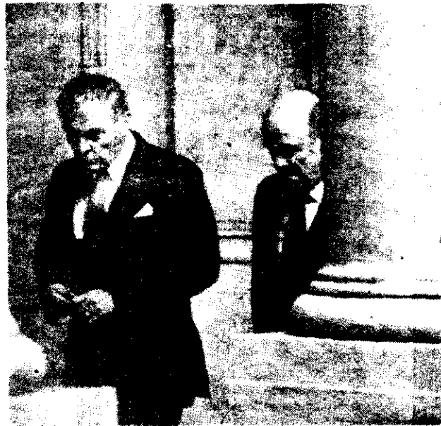
CON LOS ROSTROS que denotan una expresión no precisamente bélica, el secretario de Estado norteamericano, Alexander Haig, y el canciller argentino, Nicanor Costa Méndez (derecha), salen del recinto en el que sostuvieron una nueva plática para llegar a acuerdos sobre el conflicto de las islas Malvinas. No existen versiones oficiales sobre los resultados de esas conversaciones, mantenidas ayer en Buenos Aires.

No hubo indicios previos de la imposición de una medida similar en el espacio aéreo.