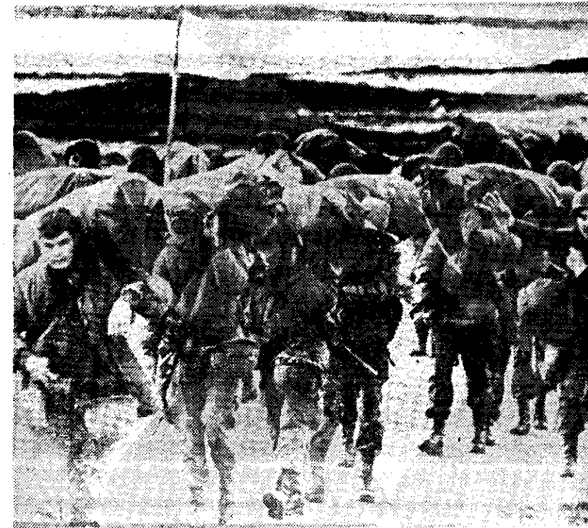
SOLDADOS ARGENTINOS cargan sus bolsas de equipo al llegar ayer a las Malvinas a reforzar las tropas que ya la ocupan para contrarrestar cualquier intento británico por recuperarlas.