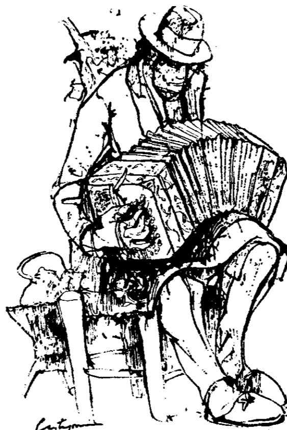
Imágenes de tango, de Castagnino