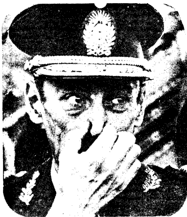
GENERAL JORGE VIDELA: bajo su gobierno el periodismo es muy golpeado

El señor Robert Cox, inglés de nacimiento, llegó a la Argentina en 1969, cuando el Herald era todavía pro-