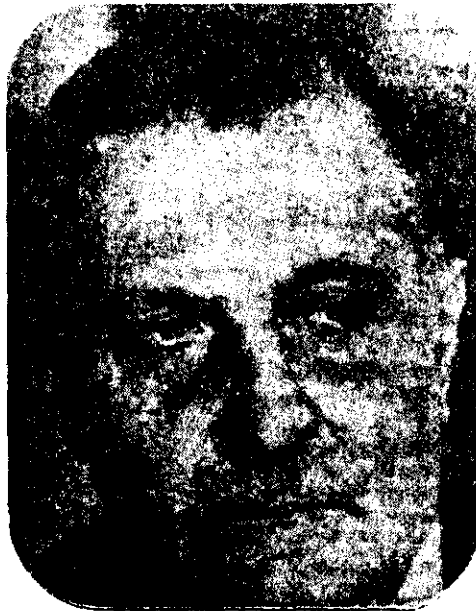
GENERAL ROBERTO VIOLA, Teórico y animador de la cruzada continental contra la "subversión comunista".

A partir de 1945 aumentó la penetración norteamericana, ahora en la forma de una integración regional dirigida por el Pentágono. Para ello, los Estados Unidos suscribieron con estas naciones pactos de "defensa mutua"; las llenaron de misiones militares y armamentos modernos; crearon escuelas de entrenamiento en los propios Estados Unidos