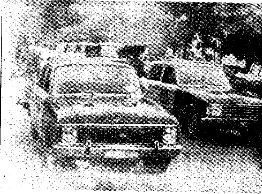
POLICIAS BONAERENSES esperan junto a sus vehículos la salida del ex Presidente Héctor J. Cámpora de la embajada mexicana en Buenos Aires para escoltarlo hasta el Hospital Italiano. El ex Mandatario argentino fue sometido ayer mismo a complicados exámenes médicos.

El gobierno argentino informó públicamente por la