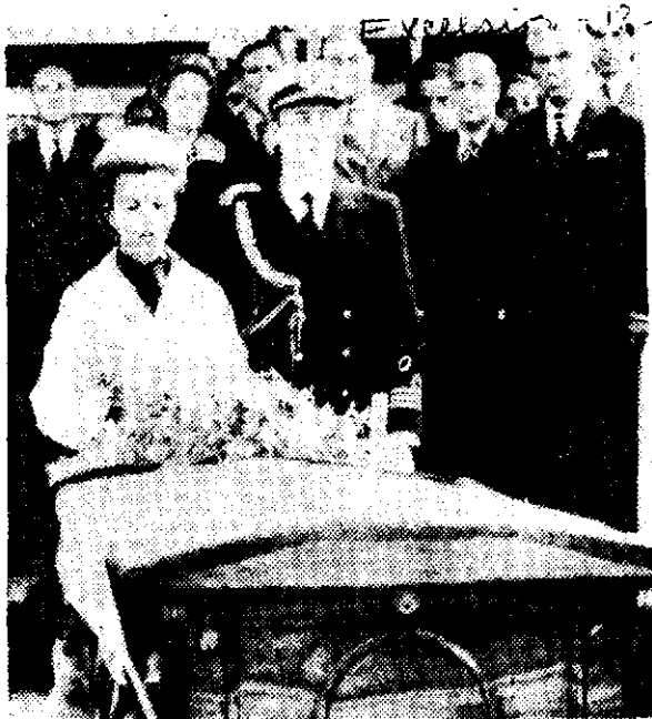
ISABELITA PERON, Presidenta de Argentina, ante el ataúd con los restos de Eva Perón, llegado ayer a Buenos Aires desde Madrid.