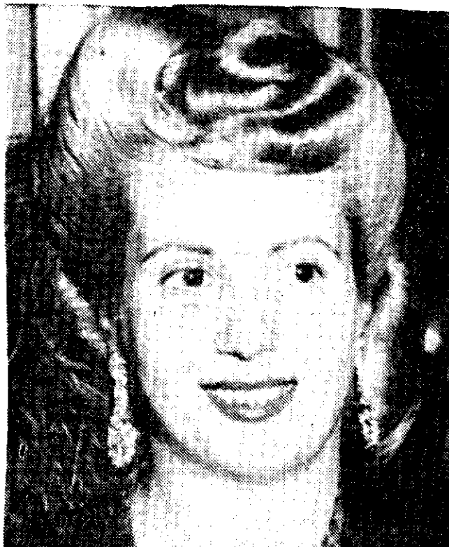
Los restos de Eva Perón, cuya foto es de 1947, la segunda esposa del fallecido Juan Perón, fueron llevados de regreso a Argentina ayer. El cadáver permanecía en Madrid, donde Perón pasó la mayor parte de su exilio. Eva Perón se hizo muy popular en Argentina en la década de los cuarentas y los cincuentas al efectuar un ambicioso programa de bienestar social.

La llegada de los restos de "Evita" coincidiría con el segundo aniversario del regreso de Perón al país, cuando el extinto mandatario, puso fin a un exilio de 17 años.