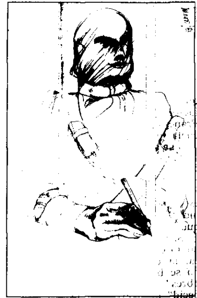
PRESOS POLITICOS ARGENTINOS