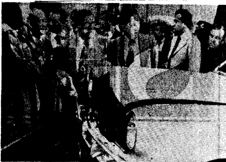
EL MINISTRO argentino de Economía, José Martínez de Hoz —izquierda, de lentes— y otras personas observan los daños al automóvil del secretario del Tesoro, Juan Alemann, que sufrió un atentado ayer, cuando a bordo del vehículo se dirigía a Buenos Aires. El funcionario resultó ileso y su chofer y el guardaespaldas quedaron heridos.