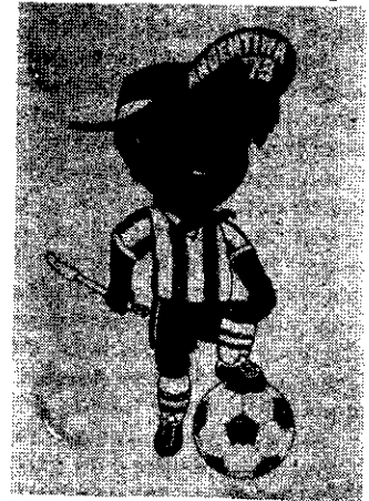
.....y el Mundial