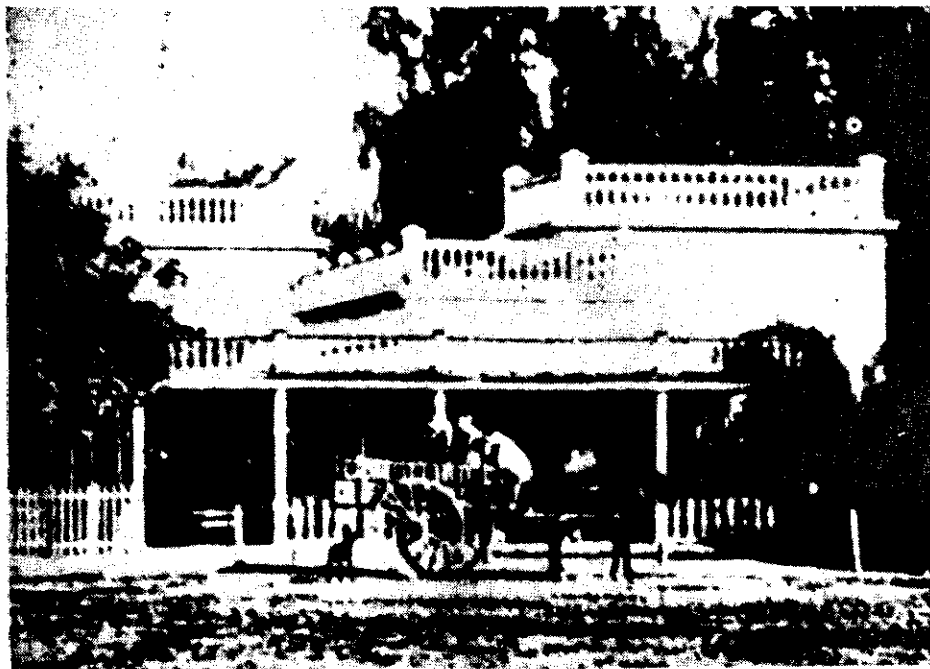
El Famoso Hansen

Es el año en que Buenos Aires asiste a la construcción de numerosos edificios, a su embellecimiento mediante la importación de numerosas obras escultóricas adquiridas en Europa por una comisión de artistas; año en el que un inventario de sus teatros de primera línea indica ya más de una veintena de salas; el mismo en que se verifica el florecimiento de las grandes tiendas metropolitanas y la nueva moda que se acentúa: la estre-