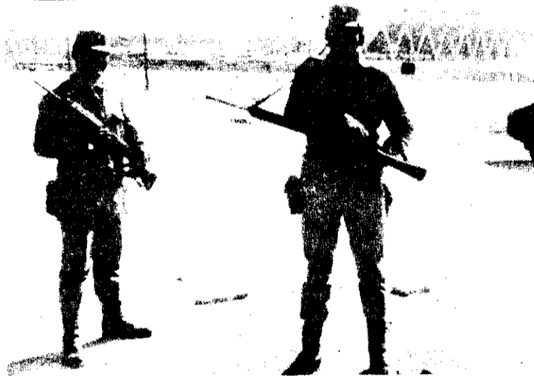
CORDOBA. — POR todas partes, en especial cerca de las instalaciones y centros de concentración de los equipos, hay vigilancia, por parte de soldados y demás guardianes.