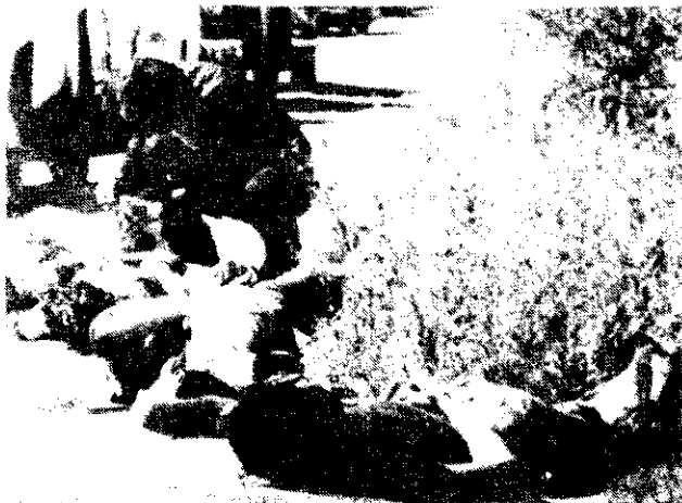
Cadáveres maniatados de nueve estudiantes bolivianos, peruanos, argentinos y uruguayos, arrojaron al camino en enero de 1977, en Argentina, según el filme Las AAA son las tres armas.

En la noche, efectivos de las Fuerzas Armadas argentinas se agolpan en la puerta de un departamento. Lo abren a violentas patadas y una vez adentro inmovilizan a golpes a un hombre y una mujer. El único sonido de fondo que se escucha es el accionar a mansalva contra los muebles de la casa: el principal objetivo son los libreros. Allí buscan febrilmente los títulos que al parecer los irritan. Destrozan todo el contenido de los anaqueles. Luego de la devastación, se van. Llevan arrastrando el cuerpo de la víctima anteriormente golpeada. Tras el portazo, queda un solo testigo sobre la mesa, milagrosamente en pie: una máquina de escribir. Muda, la cámara se acerca a ella hasta dejarla en primer plano. Entonces comienza a fluir, en off , las palabras de la carta abierta que el militante y escritor argentino Rodolfo Walsh enviara a la Junta Militar que gobierna aquel país, en ocasión de cumplirse el primer año de su acción genocida.