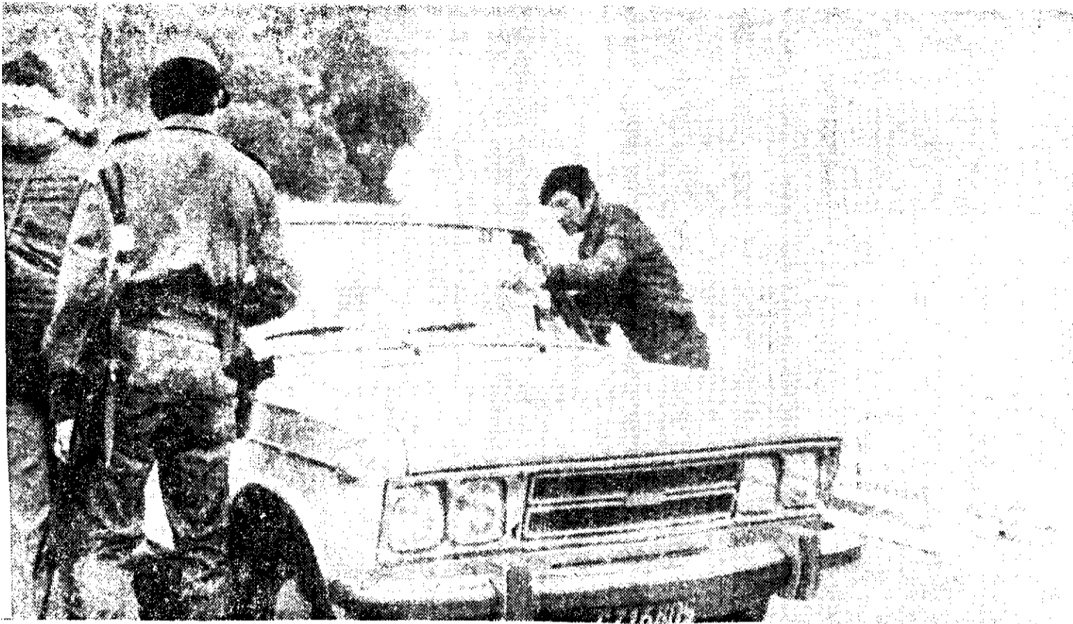
LAS MEDIDAS de seguridad en el estadio de River Plate en Buenos Aires, Argentina, son al máximo. Los soldados bajan a los tripulantes de cada vehículo y los revisan.