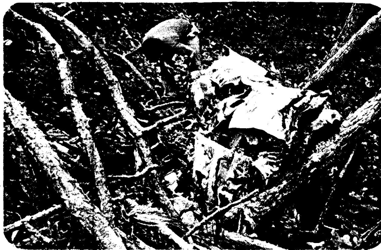
Los restos del avión en que viajaba Graiver, quedaron dispersos en una vasta área que asta el momento no ha sido inspeccionada en su totalidad. Algunas partes de la nave quedaron incrustadas en los árboles o colgando