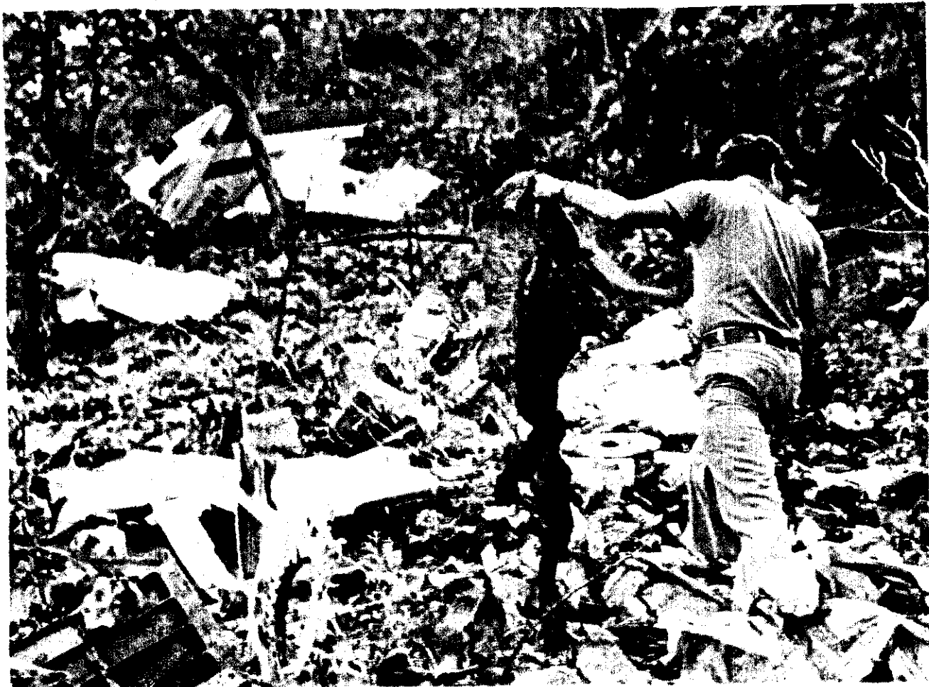
Un vecino de Ixtimalco, Guerrero, muestra una chamarra de piloto hallada entre los restos del avión en el que supuestamente murió David Graiver, cuando el aparato se estrelló al aproximarse a Acapulco.