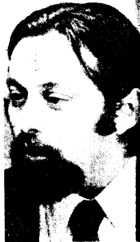
Estos son 2 aspectos de Graiver destacados por la Revista Somos, de Argentina.