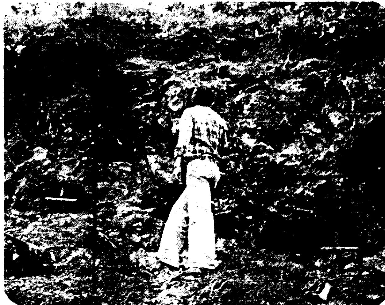
Dos cruces solamente colocaron los lugareños de Ixtamalco donde se indicó que habían muerto tres personas.