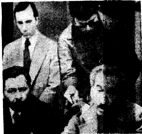
CASILDO HERRERAS, derecha, secretario de la central obrera argentina CGT, al pedir al gobierno el establecimiento en Argentina de un estado de emergencia económica durante 90 días. (AP) (Información en la página 3)

Y concluyó preguntándose "si muchos hechos de violencia no han sido producidos por los mismos grupos a los que las víctimas pertenecían".