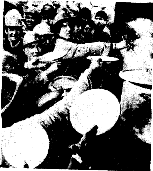
Los obreros argentinos, que en algunas fábricas tienen que adquirir comida caliente mediante un fondo común, en razón del problema inflacionario que afecta al país, pidieron que se declare un estado de emergencia económica..

En Córdoba se informó que por lo menos 30 presuntos extremistas de izquierda fueron capturados, y agentes policiales confiscaron armas y propaganda en varias acciones esta madrugada. Fuentes policiales dijeron que los detenidos son miembros de la organización guerrillera izquierdista “Montoneros”, que en las últimas 2 semanas perpetró ataques con bombas y ametralladoras en Buenos Aires y Córdoba, con un saldo de 6 muertos y varios heridos.