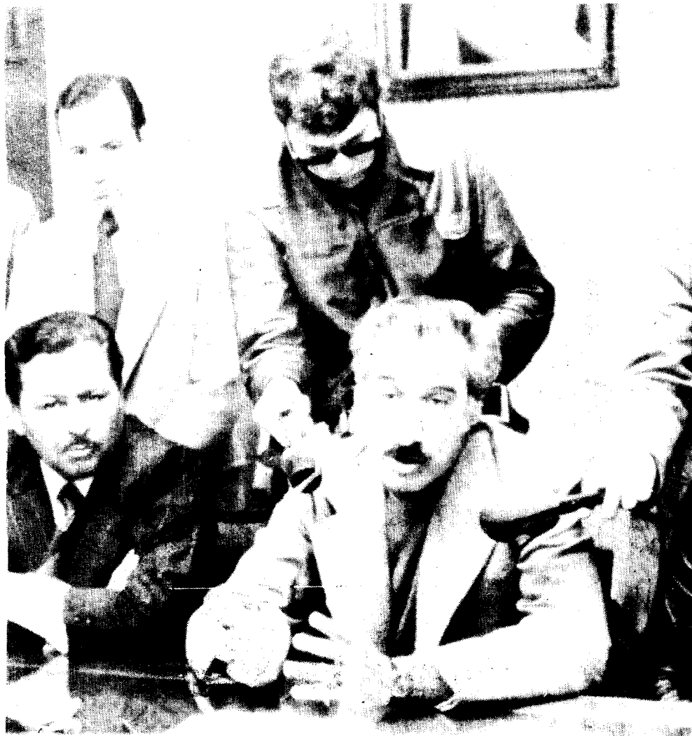
BUENOS AIRES.— El secretario general de la CGT argentina, Casildo Herreras demandó al gobierno que decrete estado de emergencia por 90 días para contrarrestar la inflación, el desempleo y la recesión económica que agobian al país.

El "estado de emergencia económica" fue pedido en una reunión que los dirigentes de la Confederación General del Trabajo (CGT), la única central sindical del país —que agrupa a unos dos y medio millones de trabajadores y es dominada por los peronistas—, mantuvieron con el ministro de Economía, Pedro Bonanni, quien prometió una respuesta oficial para mañana.