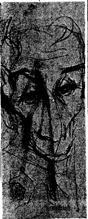
Trama de Discépolo