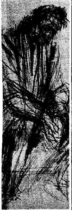
El clown triste