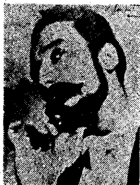
CARACTERIZACION de "Wunder Bar".

De las impresiones de su viaje a Europa que hizo en 1937 escribió: "Cuando yo llegué, Madrid era una ciudad sin casas. Todo el mundo vivía en las calles. Al madrileño las casas sólo le sirven de pretexto para echarse a la calle. Toledo no me pareció una ciudad: me pareció un sueño retrospectivo. Uno de esos sueños que solemos tener cuando nos quedamos dormidos con un libro de estampas en la mano. Barcelona tiene un aire cosmopolita que la acerca a Buenos Aires. Un Buenos Aires donde hablando castellano a veces se hace uno entender... Lisboa es un cromo anacrónico. El tiempo se detuvo ahí quinientos años atrás. Tiene un ambiente colorido y dramático. Parece una postal sobre un lecho de sangre... París, al principio, da la impresión de una ciudad inhospitalaria, pero cuando uno la conoce a fondo, cuando se adentra en su alma, cuando profundiza en la intimidad de los parisienses, entonces... es más inhospitalaria todavía... Marruecos es un cielo muy alto y unas estrellas muy bajas. Las casas parecen telones remendados. A la gente no la pude ver porque iba envuelta en ropa. Marruecos parece una enorme tienda de ropa vieja en la que de pronto los trajes se han echado andar por su cuenta..."