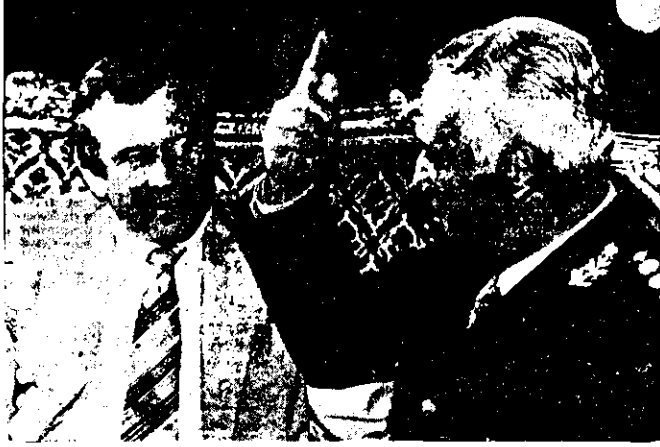
EL GENERAL Galtieri a Howard Baker, líder de la mayoría del Senado norteamericano: "—Mi gobierno es mejor que el de Viola. Ya ha aparecido UNO de los "desaparecidos", ¿vivo?"

De ahí que, se añada en la declaración, los firmantes rechacen de plano "toda escritura ejercida desde dentro de cualquier mecanismo represivo o desde fuera de un marco ideológico que no repudie la miseria, la explotación y la violencia indiscriminada cualquiera sea su signo, como método de imposición política".