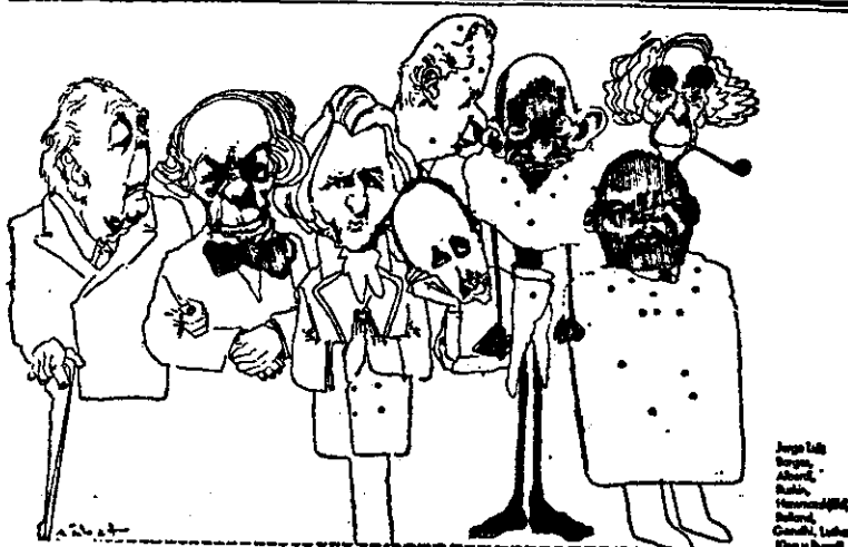
JORGE LUIS BORGES, con quienes considera ilustres compañeros suyos, pacifistas: Alberdi, Ruskin, Hammarskjöld, Rolland, Gandhi, Luther King y Russell.