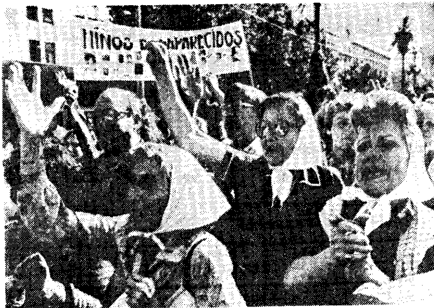
CIENTOS DE PADRES de familia realizaron una manifestación por las calles de Buenos Aires, Argentina, para exigir información relativa a sus hijos desaparecidos en la década de los setenta.