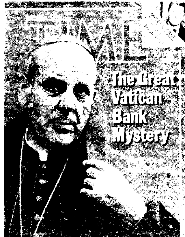
LAS OPERACIONES non sanctas de la banca vaticana.

Es voz pública en la Argentina que las huellas de este nuevo crimen conducen en línea recta a Massera y a las bandas asesinas con él conectadas, en esta caso como represalia por las denuncias formuladas por el hermano de la víctima. Del mismo modo, se subraya la responsabilidad del contraalmirante en la eliminación, no sólo de Elena Holmberg, sino también del ex diplomático Hidalgo Solá, del gremialista Oscar Smith, y otros. El ex integrante de la Junta Militar argentina y comandante de la armada quiere barrer a sangre y fuego todos los obstáculos que se interpongan a su candidatura a la presidencia.