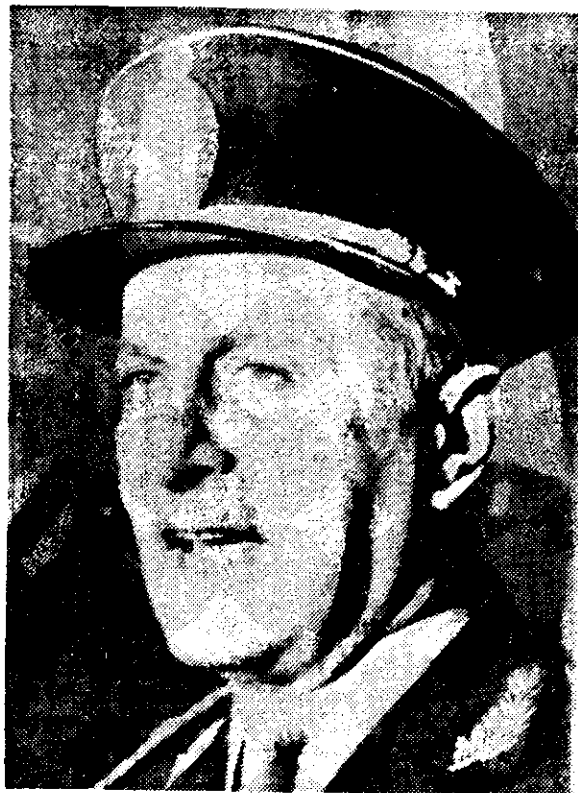
EL GENERAL retirado Roberto Eduardo Viola fue elegido el viernes presidente de Argentina. El militar de 55 años conocido como "El Viejo", ascenderá al poder en marzo.