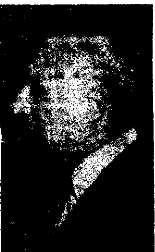
BRIGADIER Osvaldo Cacciatore y escritor Ernesto Sábato; el comisario y el yogui.