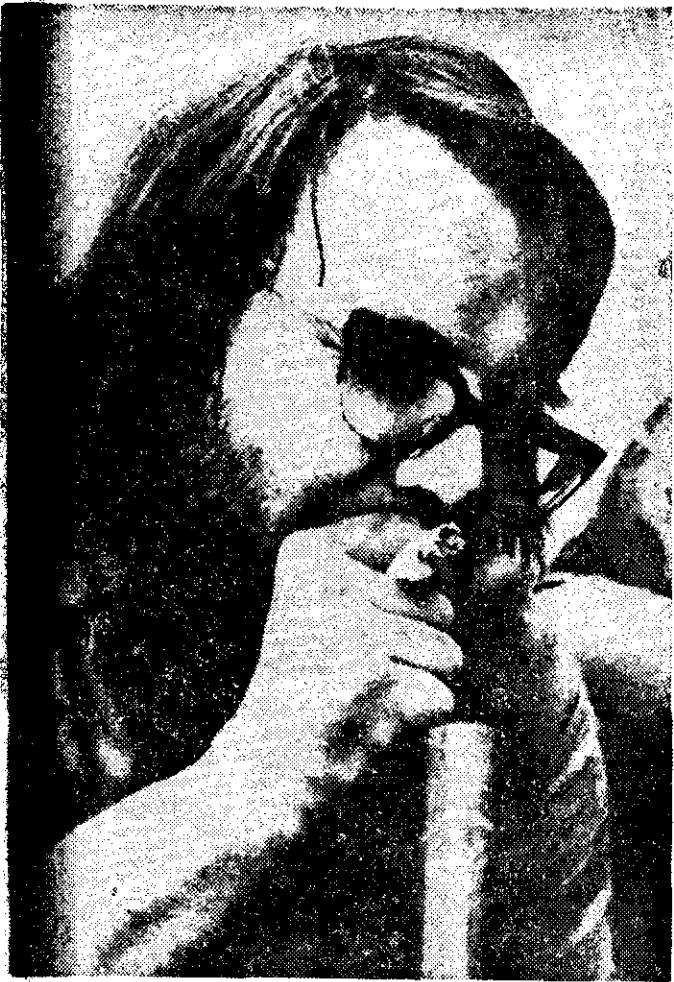
EN ALGUNOS paseos de Argentina, se pueden aún ver jipis fumando marihuana.

tenso trabajo o estudio o combatan las depresiones. También son el primer paso hacia la marihuana o la cocaína, en una palabra la drogadicción.