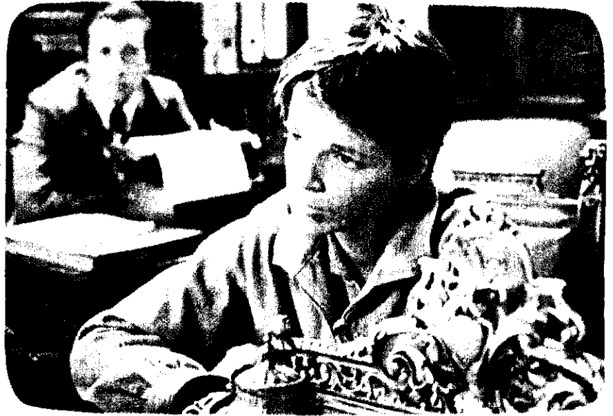
Marilina Ross, gran actriz argentina