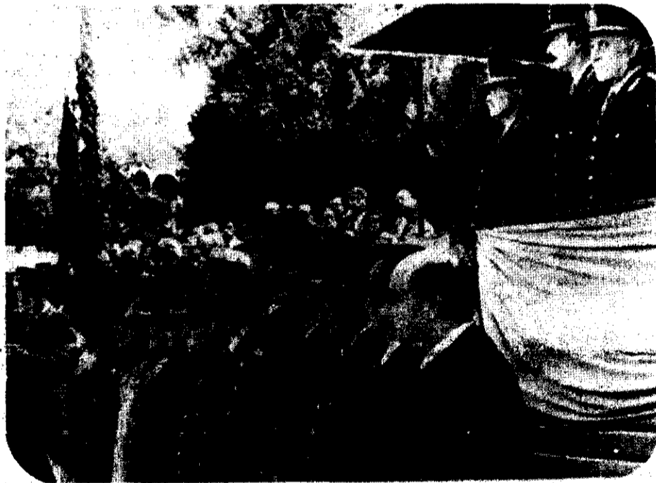
EL COMANDANTE de las Fuerzas Armadas argentinas, general Roberto Viola (arriba, derecha) preside, junto con el mandatario Jorge Videla (a su lado), una ceremonia militar en Buenos Aires, después de sofocada la revuelta que encabezó el general Luciano Menéndez.

Señala que "el espectro de un golpe de Estado, a contramano del curso que se va imponiendo paulatinamente en toda América Latina", se alza contra la solución política concreta que todas las fuerzas políticas, económicas y sociales reclaman al actual gobierno militar.