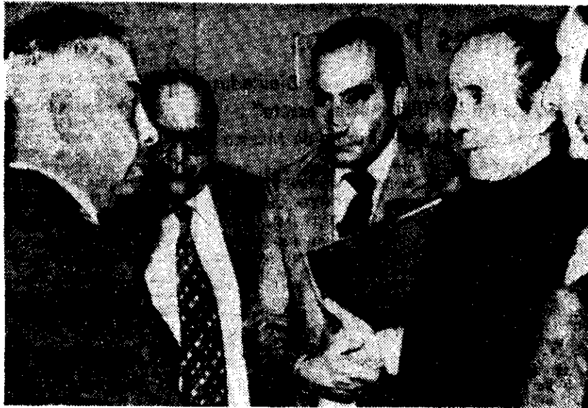
EL GENERAL Luciano Menéndez —izquierda— explica a los periodistas las razones de su levantamiento, que fue abortado sin dispararse un tiro, ayer, en Córdoba, Argentina, antes de dirigirse a Buenos Aires, donde se entrevistó con el general Roberto Viola quien lo destituyó. El militar insurrecto exigía la dimisión del comandante en jefe del ejército argentino.