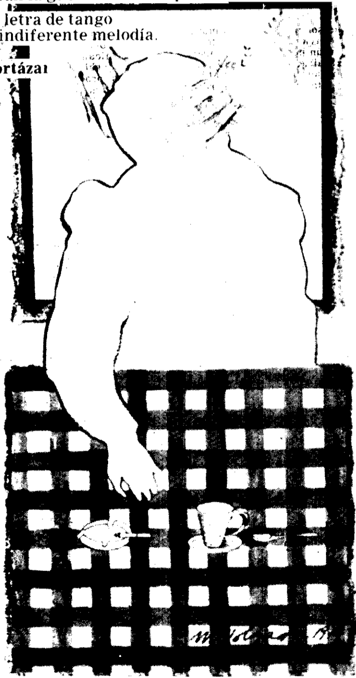
Dibujo de Myriam Holgado.