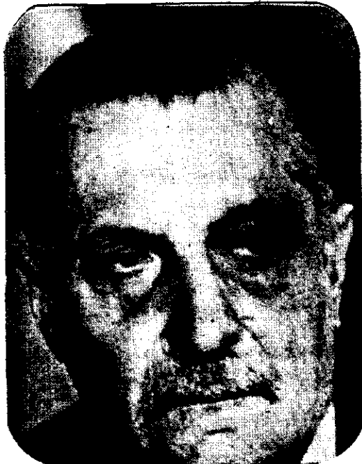
GENERAL ROBERTO VIOLA: ¿Le servirá el intento golpista del general Menéndez para mantenerse en el comando máximo del Ejército hasta agosto de 1980?

Los cálculos son ahora muchos, pero la pirámide del escalafón de esa fuerza ofrecerá sin duda este año una movilidad inesperada para las esperanzas de los jefes que aspiran a ascensos. Porque, además del pase a retiro de Menéndez y Maradona, se espera que no menos de una docena de otros oficiales que les acompañaron en la frustrada tentativa de fines de septiembre, seguirán el mismo descenso final en su carrera.