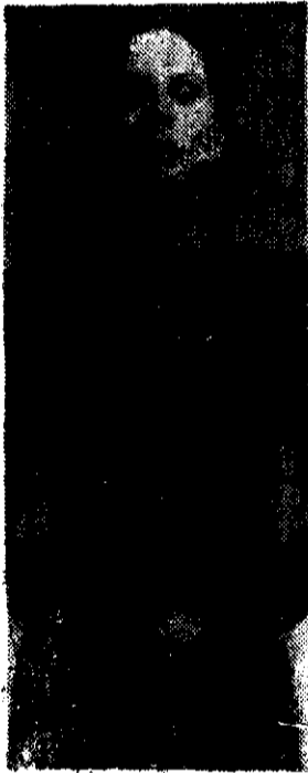
La artista argentina