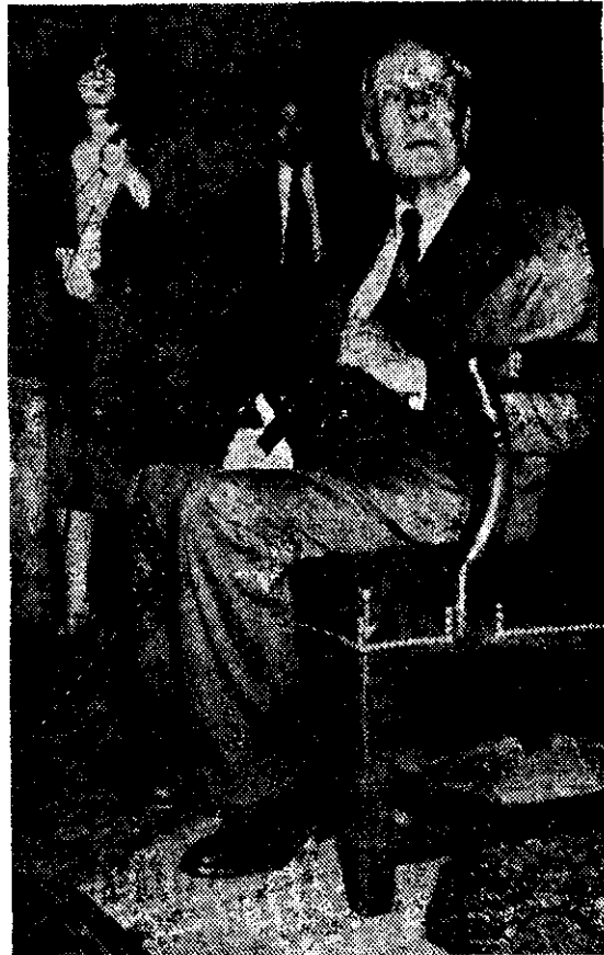
JORGE LUIS Borges, poeta y novelista argentino ofreció una conferencia anteayer en la Universidad de Columbia en Nueva York.