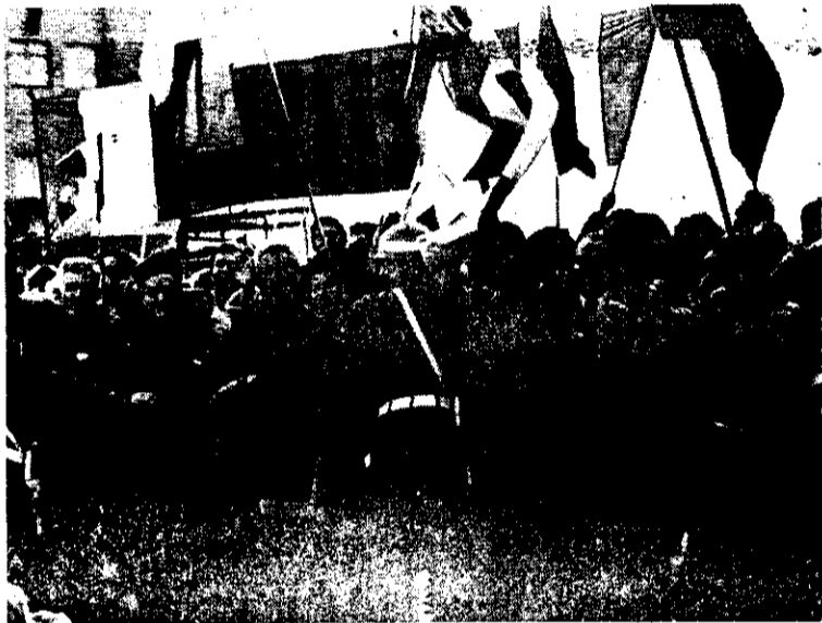
BUENOS AIRES. Bastantes apuros pasaron las fuerzas públicas en Ezeiza, para controlar a los "tifosi" que fueron a dar la bienvenida a la Selección de Italia.