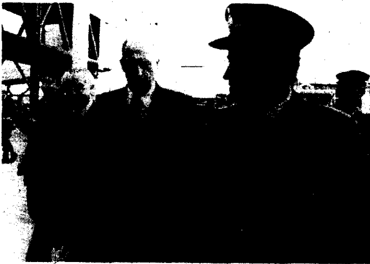
BUENOS AIRES. — El brasileño Joao Avelange, presidente de la FIFA es custodiado al bajar del avión que lo trasladó a la capital de Argentina.