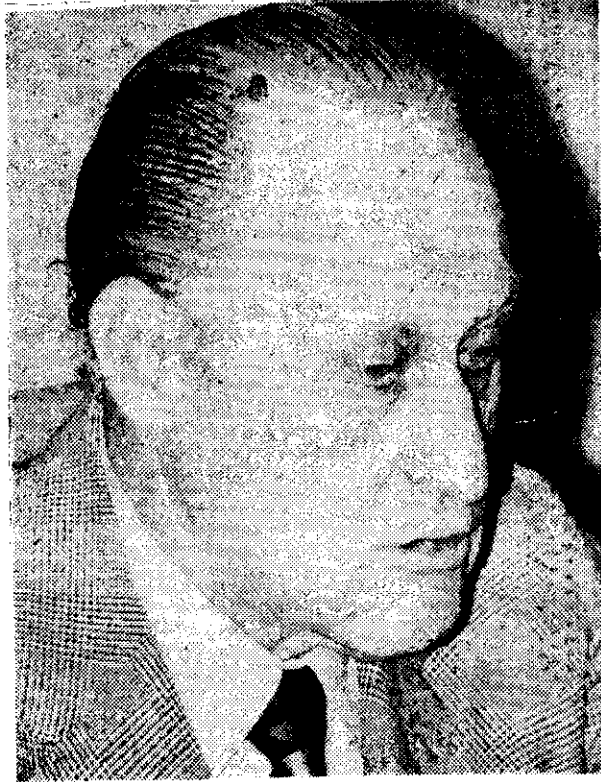
JOAO HAVELANGE, presidente de la FIFA, dijo en Brasil que nunca había recibido presiones para retirar el Campeonato Mundial de Argentina.

Las eliminatorias en América del Sur, según Havelange, serán realizadas entre el 31 de marzo y el 31 de junio de 1977, como se decidió en Guatemala.