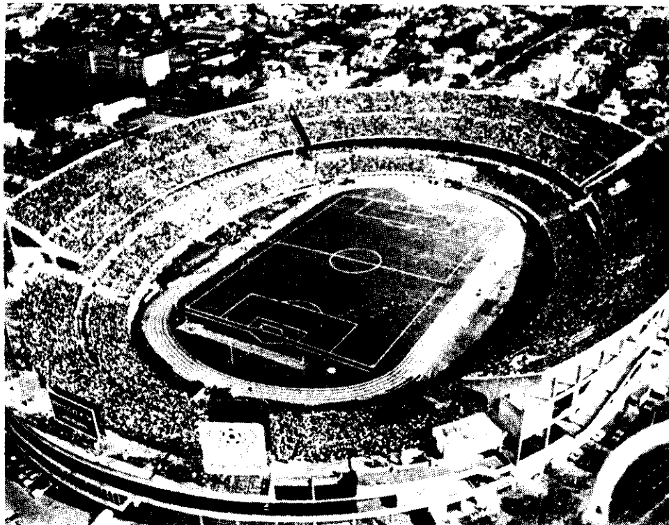
En unos días más se iniciará la remozación del estadio River Plate, que será el escenario principal del próximo campeonato mundial de futbol de 1978 en Argentina.