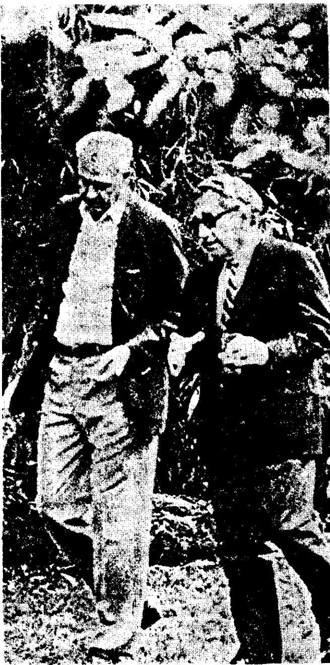
EL NUEVO MINISTRO de Economía argentina, Roberto Alemann, pasea a fines de noviembre de 1981 con Henry Kissinger, durante un almuerzo criollo en la hacienda "Las Mercedes", en el interior de la provincia de Buenos Aires.

"Esa experiencia de 1955 me enseñó que hay que entrar a fondo en la estructura social de los