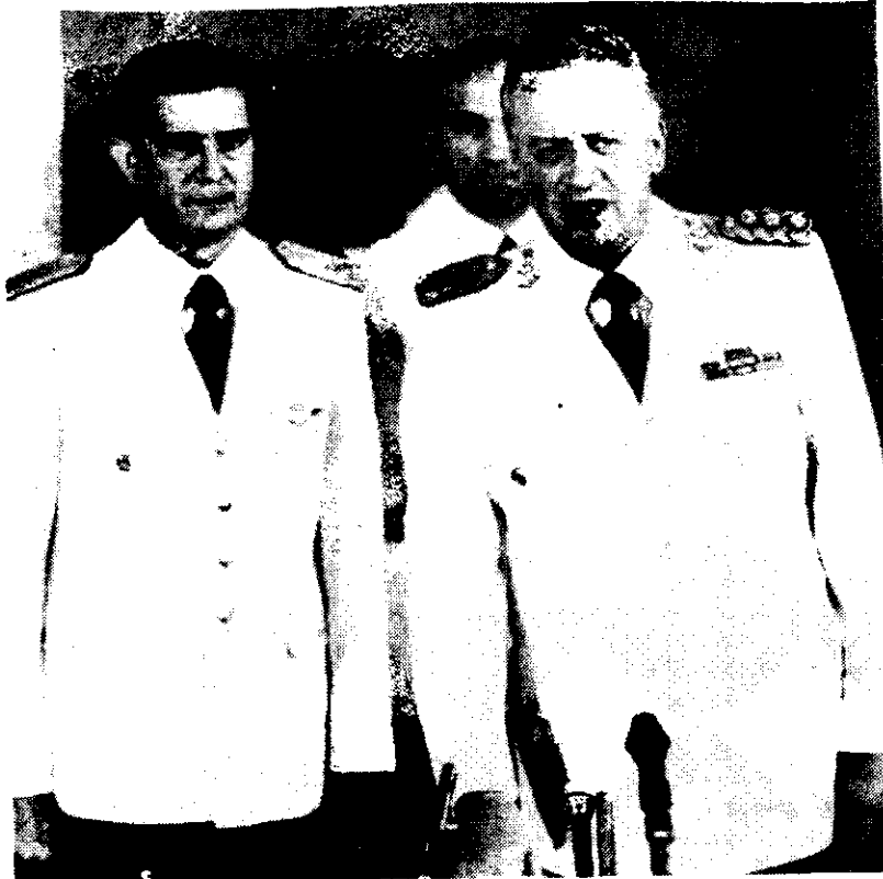
El general Leopoldo Galtieri en el momento de asumir ayer en Buenos Aires la presidencia de Argentina, en medio de severas críticas de todos los sectores políticos, que exigen el retorno a la democracia.