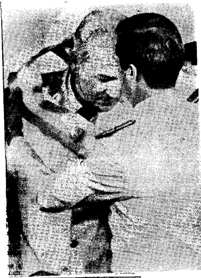
EL GENERAL Leopoldo F. Galtieri asumió ayer la Presidencia de la República de Argentina. Recibe la investidura de manos del comandante de la Fuerza Aérea, general Basilio Lami Dozo. Ejercerá su mandato hasta marzo de 1984. (Información en la página 2)

Mañana Galtieri habrá de dirigir su primer discurso a la nación, en el cual se espera que explique el futuro que espera al proceso de apertura política iniciada por el ex Presidente Viola.