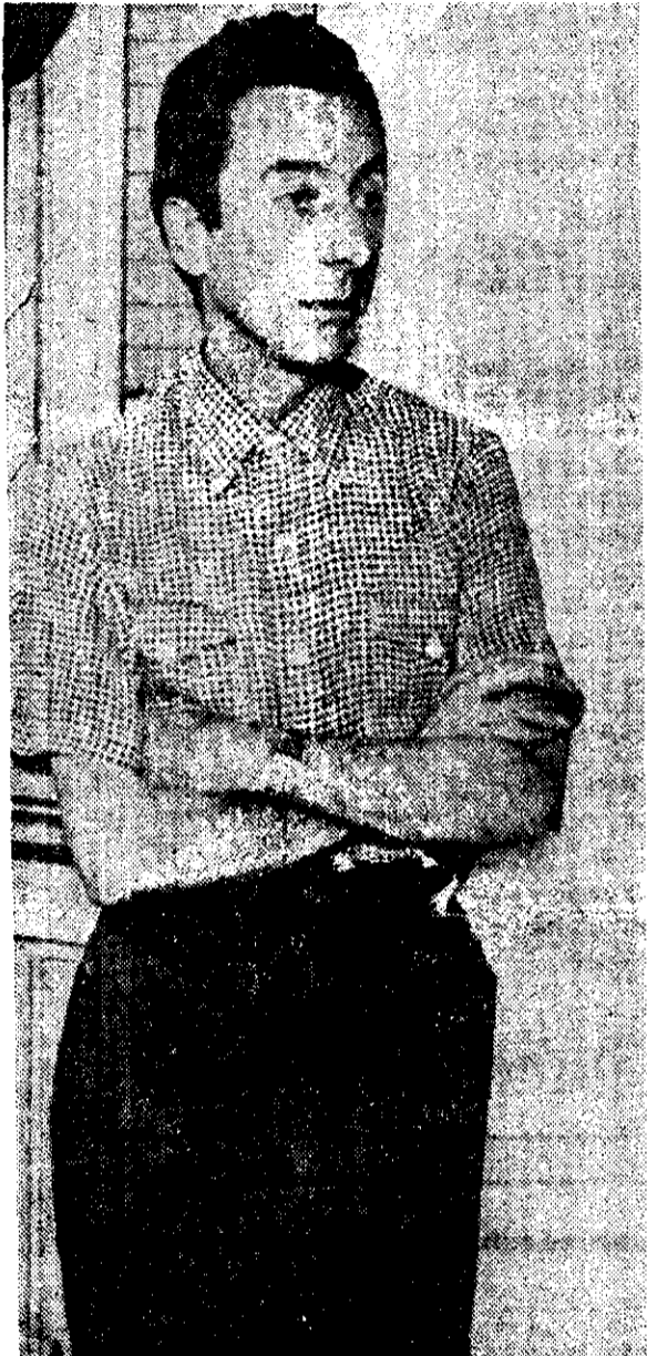
El 23 de diciembre cumplió 30 años de muerto

"Se puede escribir con un dedo, pero con el alma; un tango es la intimidad que se esconde y es el grito que se levanta desnudo. El tango está en el aire; está en el vuelo curvo de los pájaros. En la pared descascarada que muestra una llaga de ladrillos; está en la esquina más distante, y está también presente, en esta esquina que forman tu corazón y yo..."