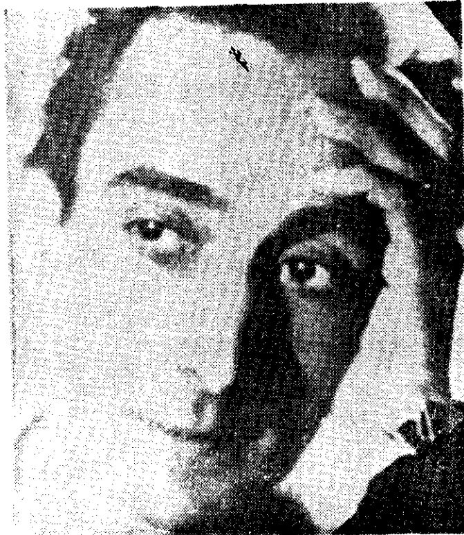
El compositor argentino Enrique Santos Discépolo