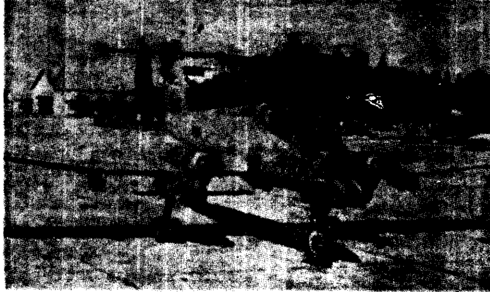
PROTOTIPO DEL avión Pucará AI-58 COIN (contrainsurgencia), que Argentina dejará de producir por falta de interesados en el exterior.

Para todo lo demás las referencias eran entusiastas: "notable capacidad de reacción en el combate y una aptitud especial para operar en zonas montañosas o muy escarpadas; el radio de viraje mínimo le permite por un lado 'aferrar' el blanco, que no puede así