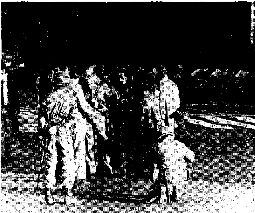
VARIOS TRANSEUNTES son registrados por los soldados en Buenos Aires.