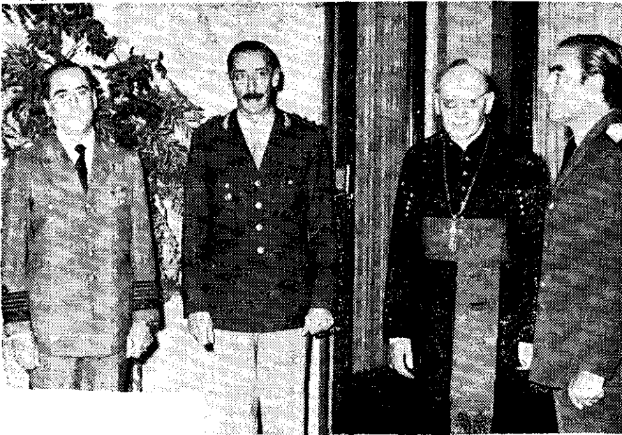
BRIGADIER ORLANDO Agosti, general Jorge Rafael Videla —Presidente— y el almirante Emilio Massera, integrantes de la junta militar argentina, con el arzobispo y vicario castrense, monseñor Adolfo Tortolo.

El Presidente Jorge Rafael Videla manifestó hoy que la libertad de prensa será respetada, durante una reunión que tuvo con los directores de los diarios metropolitanos. Dijo que su intención, al reunirse en primer término con los representantes de la prensa independiente, era mostrar púb-