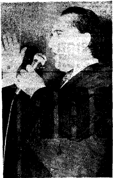
HUGO DEL CARRIL

El cantante de tangos tendrá una buena acogida en México no sólo por sus muchos amigos, sino también por parte del público. Actualmente sus películas se proyectan por televisión.