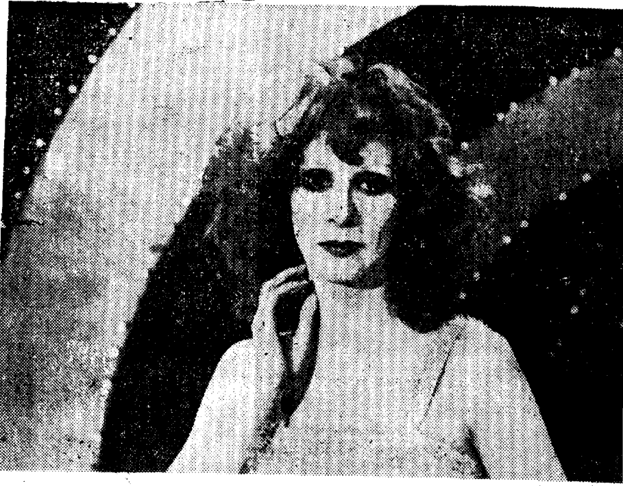
"ALGO ESPECIAL CON... NACHA GUEVARA", es el gran espectáculo que presentará por Canal 13 la polifacética artista argentina, una de las más talentosas vedettes de América Latina. Esta emisión se trasmite mañana domingo a las 20:00 horas, y constituye uno de los más completos shows presentados en esta revista serie dominical.