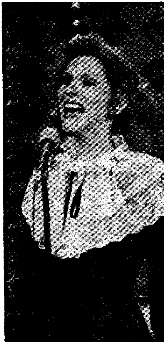
NACHA GUEVARA aparecerá mañana en la sección "Momentos estelares", de la serie "Siempre en domingo".