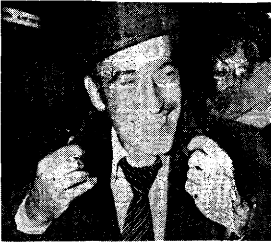
MIGUEL ANGEL ESTRELLA, a su arribo a París, sonrió a todos sus seguidores que lo fueron a esperar al aeropuerto.