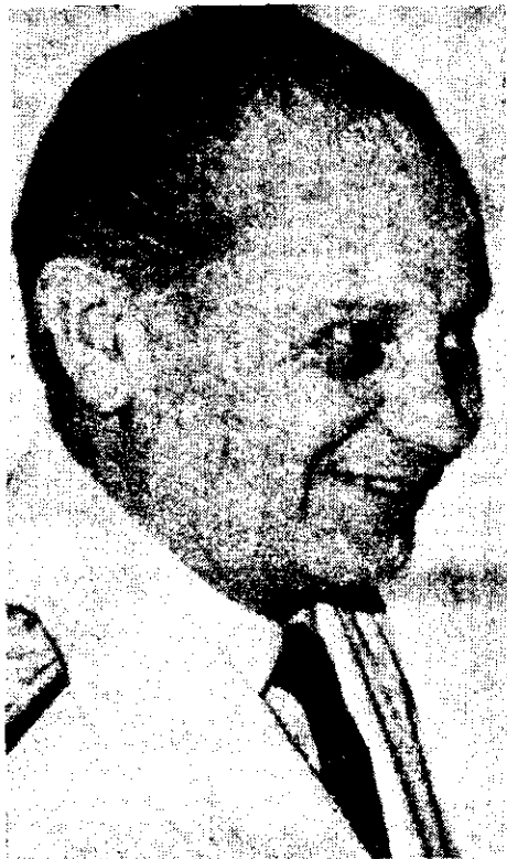
La policía de Buenos Aires informó ayer que el ministro de Relaciones Exteriores de Argentina, César Guzzetti, resultó herido tras un intento de asesinato en un tiroteo de guerrilleros izquierdistas.

Horas después de la agresión cobró solidez una interpretación policial que indicó: Guzzetti concurrió al hospital "Córdoba" a unos 3 kilómetros al oeste de la casa de gobierno para una revisión médica tal como lo suele hacer semanalmente.