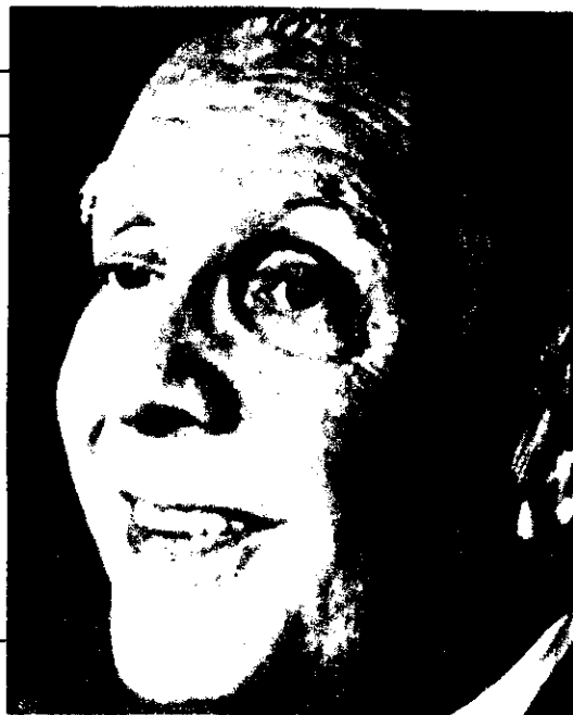
Jorge Luis Borges