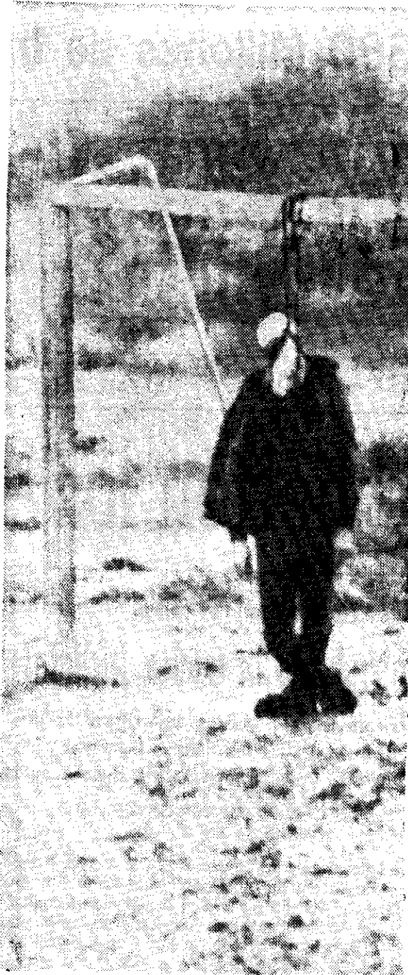
EL CADAVER de un hombre ponde del travesaño de una porteria en un campo de futbol. Fue descubierto ayer por la policia en un distrito obrero de Buenos Aires. Se conjetura un crimen pasional en que el individuo tras de ser asesinado fue colgado.