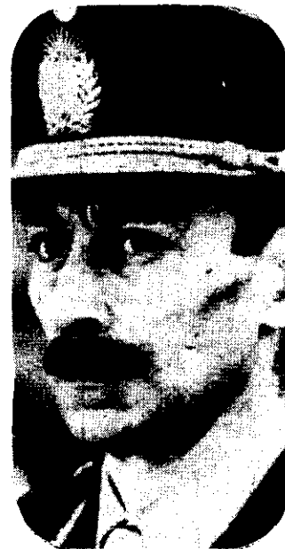
Jorge Rafael Videla

"Esta reunión, indica un documento remitido por los delegados a la prensa, no ha sido desconocida por las mismas autoridades que la adju-