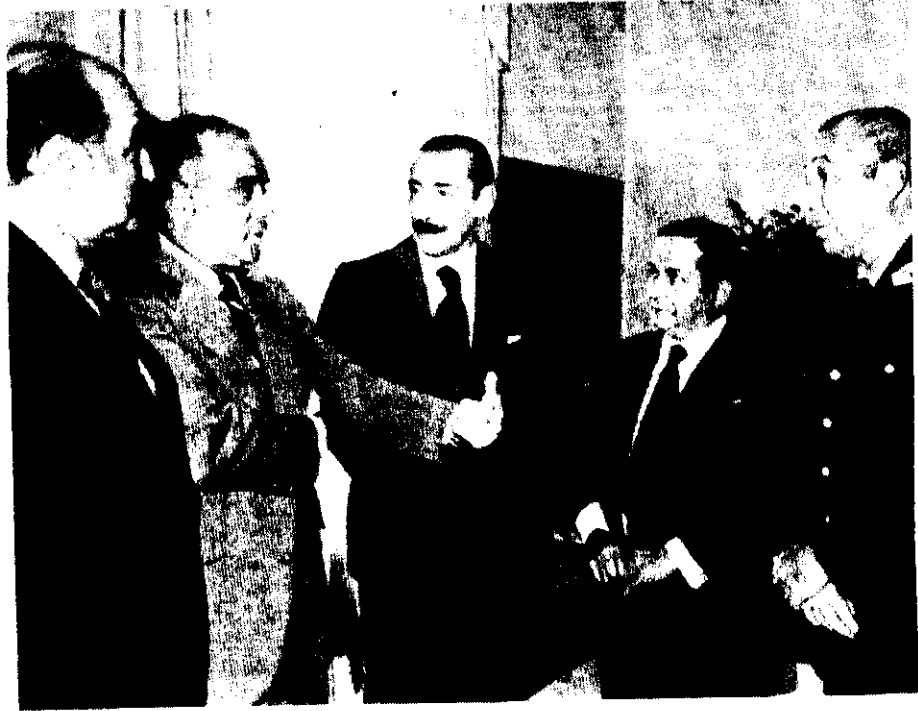
El secretario general de la OEA, Alejandro Orfila (izquierda) conversa en su casa con los representantes latinoamericanos que atestiguaron la firma de los tratados del canal de Panamá en Washington.

La condena alternativa a la muerte prevista por el Código es la reclusión perpetua y, hasta ahora, la medida sólo alcanzaba a quienes atacasen a miembros de las fuerzas armadas y de seguridad.