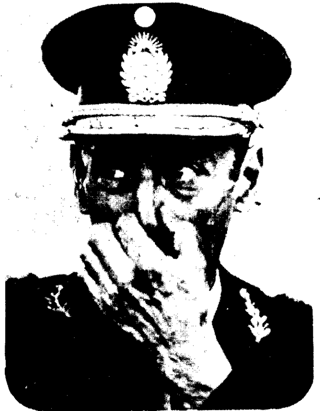
General Jorge R. Videla