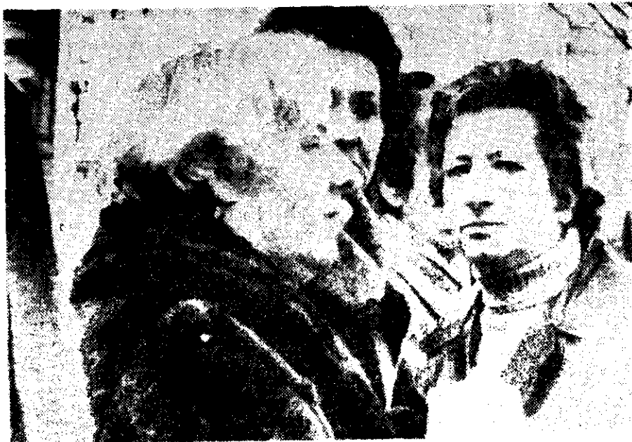
TRES MUJERES no identificadas miembros de la organización de las llamadas Locas de la Plaza de Mayo, que se reunieron ayer en Buenos Aires, para discutir un documento en que exigen el esclarecimiento de las desapariciones de más de 2,000 personas, este año.