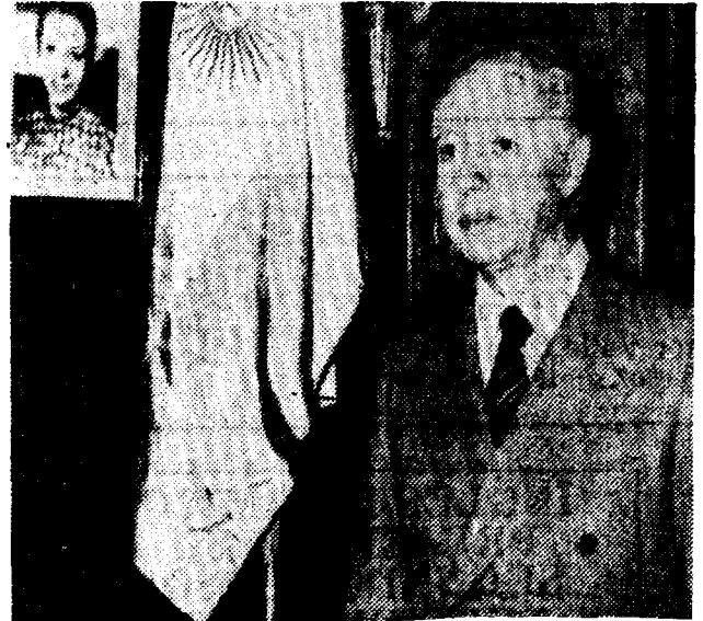
Italo A. Luder, presidente del Senado argentino, asumirá hoy el cargo de presidente interino al iniciar la señora Perón una licencia de 45 días que dedicará al descanso. (UPI).

La ceremonia de transmisión del mandato se cumplirá en el Salón Blanco de la casa de gobierno, donde comenzaron esta tarde los preparativos del caso.